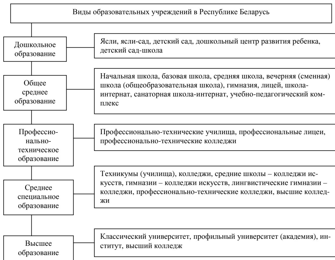
Рис. 2. Классификация видов учреждений образования