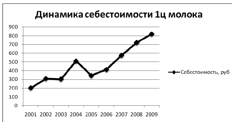
Рис. 1. Динамика себестоимости 1 ц молока за 9 лет

Таким образом, анализ себестоимости молока играет важную роль для сельскохозяйственного предприятия.