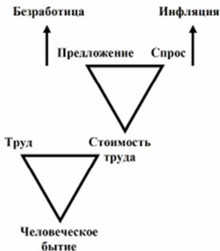
Рис. 2. Капиталистическая сублимация человеческого бытия

Оппозиция недооценка / переоценка выступает причиной образования либо избытка денежной, либо избытка массы товарной, порождающих две основные рыночные патологии – инфляцию и безработицу. Превышение потребительского спроса и избыток денежной массы из-за заниженной цены покупки приводит к инфляции, а завышение цены продажи и, как следствие, доминирование производительного спроса над спросом потребительским ведет к кризису перепроизводства и, как следствие, увольнениям и безработице (Рис. 2). В обоих капиталистических случаях страдает рабочий класс, пролетариат, рабочий, который теряет либо в подвергающейся инфляции зарплате, либо вовсе оказываясь на улице в качестве безработного. Маркс показывает, что инфляция и безработица, будучи следствием принципиальной смещенной адекватности цены, действительно выступают сопутствующими моментами саморегуляции рынка [Там же, с. 59-60].