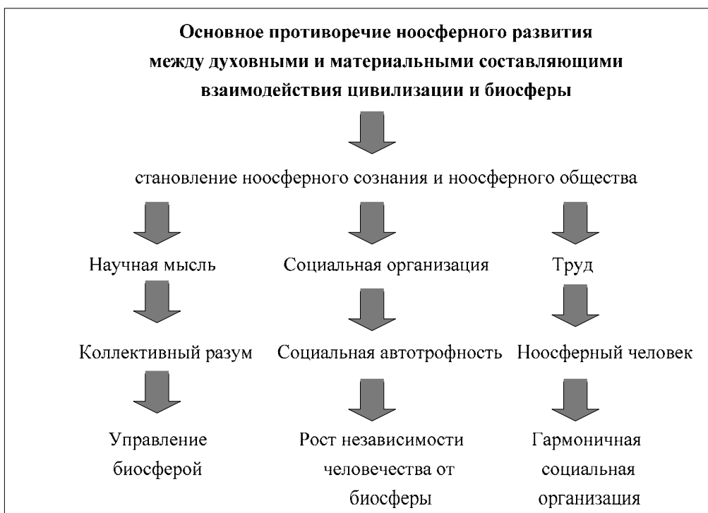
Рис. 1. Основное противоречие ноосферного развития и его решение

Так, основное противоречие между духовными и материальными составляющими ноосферного развития на уровне взаимодействия человечества и биосферы разрешается становлением ноосферного сознания и ноосферного общества и дифференцируется на три составные части: становление коллективного разума, рост социальной автотрофности и формирование ноосферного человека. Становление ноосферного человека определяет гармоничное развитие общества, коллективный разум начинает управлять организованностью биосферы, социальная автотрофность обеспечивает растущую независимость человечества от биосферы. По сути, это силы культурной биогеохимической энергии в действии: научная мысль есть главная сила управления процессами в биосфере и ноосфере, социальная организация совершенствуется в процессе ноосферного развития, а труд ведет к росту автотрофности. В результате получаем схему (см. Рис. 1).