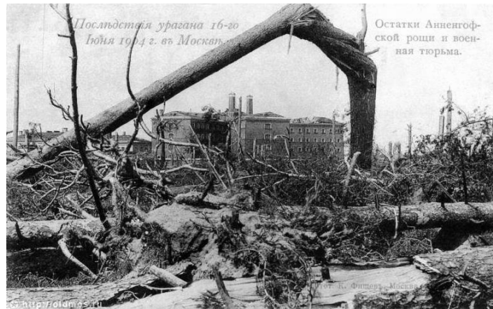
Остатки Анненговской роши и военная тюрьма. Фотография 1904 года [24]