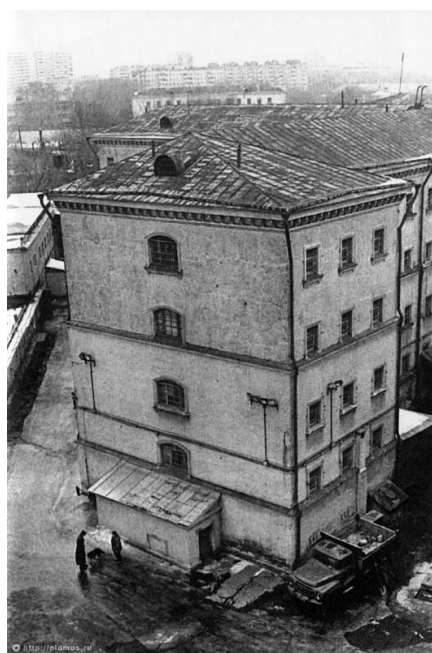
Внутренняя часть тюрьмы. Фотография середины XX века [24]