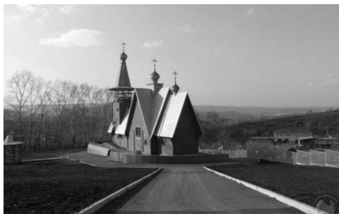
Церковь во имя Пресвятой Богородицы «Всем скорбящим радость» (Кемерово) ( http://news.vse42.ru/feed/show/id/394408 )

Во-первых, обычная прямоугольная в плане изба, отличающаяся от других построек лишь наличием восьмиконечного креста наверху. Вход в здание с западной узкой стороны избы. Например, церковь Казанской иконы Божией Матери (РПСЦ, Бийск, Алтайский край), церковь Во имя Пресвятой Богородицы Одигитрии (РПСЦ, Горно-Алтайск).