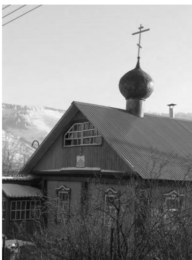
Церковь во имя Пресвятой Богородицы Одигитрии (Горно-Алтайск) ( http://staroobrad.ucoz.ru/publ/47-1-0-8 )

В Бурятии находится единственный сохранившийся до нашего времени деревянный храм с колокольней (около 1910 г.) из села Никольское, являющийся экспонатом Этнографического музея народов Забайкалья.