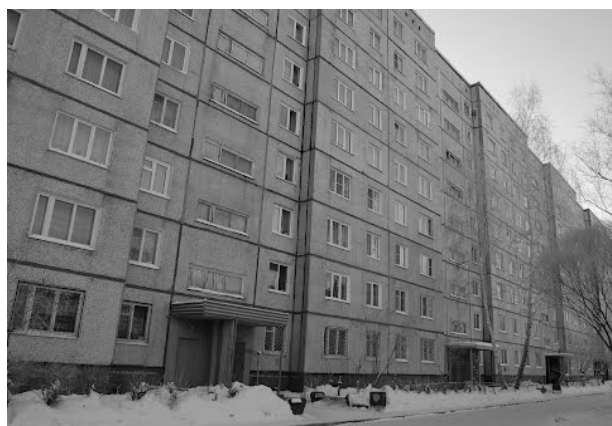
Фото № 8. Ул. Ярослава Гашека, г. Омск

Фото № 7 было сделано в Центральном округе г. Омска, на ул. Маршала Жукова. Фото № 8 – городская окраина, ул. Ярослава Гашека, микрорайон «Московка». Данное название «Московка» не является административным, используется в обиходе горожан. Нас интересовало наличие кондиционеров в жилых домах в центре города и на городской окраине. По данным фотографий видно, что жители городских окраин не придают большого значения комфортному температурному режиму в квартирах (кондиционеры отсутствуют), а жители престижного района, напротив, заботятся об оптимальных условиях своего проживания.