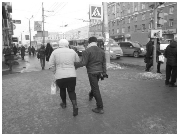
Фото № 6. Проспект Маркса, г. Омск

Фотография как документ иллюстрирует человеческие отношения.