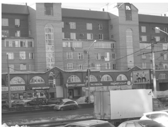
Фото № 7. Ул. Маршала Жукова, г. Омск

На Фото № 7, 8 представлены жилые дома в разных районах города.