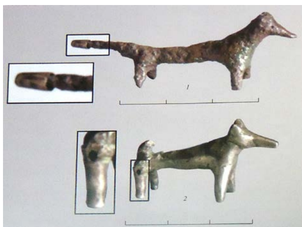
Рис. 1. Фигурки собачек из могильника Клады (по А. Д. Резепкину). Бронзовая сверху, серебряная снизу

В таком широком, общекультурном контексте следует рассматривать и фигурки двух собачек, найденных А. Д. Резепкиным. Они лежали у изголовья ребенка 7 лет под отверстием, которое служило входом во вторую камеру гробницы, среди сложенных в два-три слоя великолепных изделий из золота и дорогих камней – майкопская культура предстает здесь во всем своем блеске, на пике своего развития.