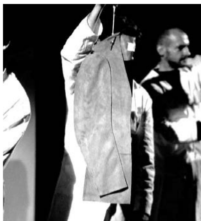
Рисунок 1. Демонстрация «плоских» предметов одежды из коллекции М. Маржеля 1998 года

Нестандартное видение моды прослеживается во многих коллекциях и проектных работах М. Маржеля. Основной идеей знаковой работы модельера, весенней коллекции 1998 года, было представление предметов одежды, хорошо сидящих на фигуре, как абсолютно плоских в двухмерном измерении (Рис. 1). Маржеля попытался воплотить эту концепцию на полном спектре предметов одежды: от брюк до рубашек и пиджаков. Одежда была изготовлена из натуральных холщевых тканей, что является как ссылкой к истории костюма прошлых веков, так и данью уважения к мастерским прошлого, ведь именно из таких простых неприглядных тканей изготавливались макеты будущих платьев из роскошных коллекций haute couture . Демонстрировались предметы одежды из данной коллекции на вешалках, которые выносили на подиум сотрудники ателье М. Маржеля, неизменно одетые в белые хлопковые халаты.