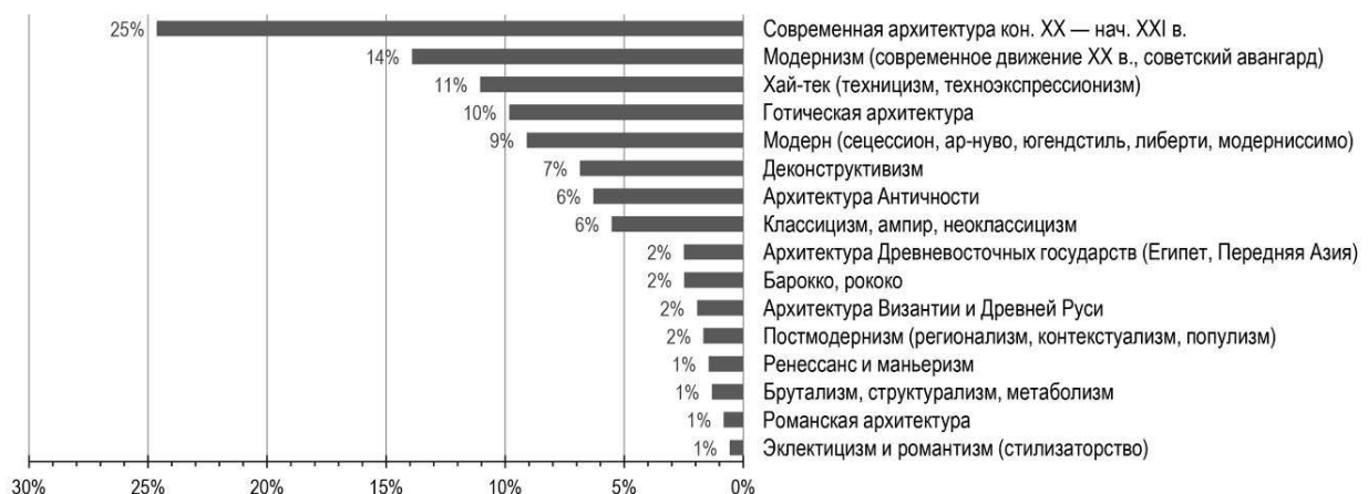
Рисунок 1. Стилиевые предпочтения респондентов

Опрос-голосование I части исследования показал (Рис. 1), что «пьедестал почета» занимают наиболее актуальные современные стилевые явления: архитектура конца XX – начала XXI в., модернизм и хай-тек. Замыкают лидирующую пятерку уже исторические стили, но с четко выраженными формообразующими принципами: готика и модерн. Соседство хай-тека и готики, по-видимому, не случайно. Оба стиля отличают вертикальная устремленность и выразительность форм за счет «артикуляции» конструктивных элементов здания, столь популярной в наш техногенный век. Но хай-тек опережает готическую архитектуру всего на один процент, вероятно, по причине актуальности первого стиля в сравнении со вторым. Относительно короткие сроки существования модерна (около 30 лет) могут стать объяснением того, что он до сих пор привлекает внимание архитекторов. По всей видимости, яркая эстетическая программа модерна не исчерпала своего потенциала и вызывает по-прежнему сильные эмоции у архитекторов.