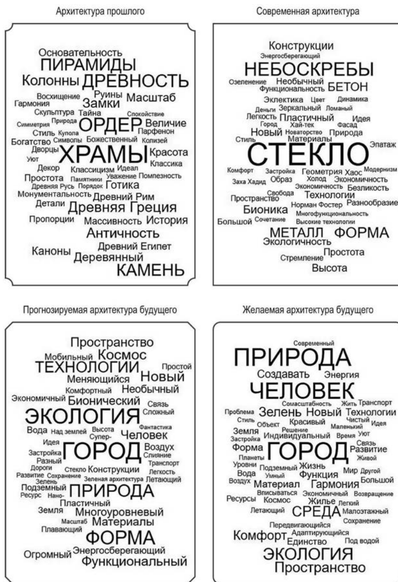
Рисунок 2. Наиболее употребляемые семантические единицы по разделам

Тема 3 «Экология и природный мир» , выраженная в словах типа: экология, природа, зелень, ресурсы, ландшафт, климат, планета Земля и др., – волнует респондентов значительно чаще в разговоре о будущем, реже – в разговоре о современности, а в разговоре о прошлом природа и ее элементы еще более редки и выступают в качестве ассоциаций (река, пески).