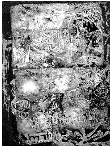
Рисунок 2. А. Фараж. «У родника». Монопринт. 2002 г.