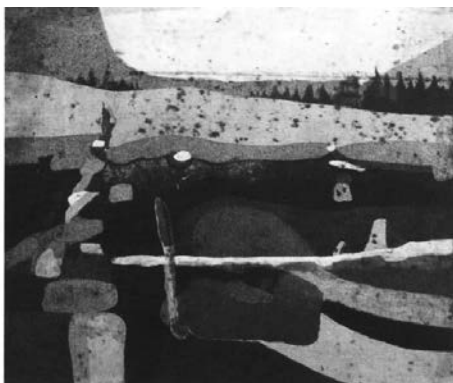
Рисунок 7. А. Сулман. «Вид города Эл-Кунайтыры». Акватинта. 1978 г.

Сулман изучил искусство гравюры в Дамаске и продолжил научные исследования в этой области в России. Его гравюры отличаются экспрессионизмом. В некоторых работах художника заметен метод сжимания площадей, который заключается в упрощении элементов до площадей различного цвета, а сочетание оттенков дает представление о перспективе, как, например, картина «Вид города Эл-Кунайтыры» (Рисунок 7), исполненная в технике гравюры на металле (акватинта).