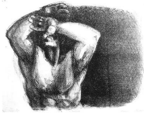
Рисунок 3. Ю. Абделки. «Умирание. 4». Литография. 1975 г.

Его первые работы отличались реализмом, как, например, картина «Умирание. 4» (Рисунок 3), исполненная в технике литографии. Потом был выполнен ряд работ в стиле экспрессионизма, например, картина «Люди. 13» (Рисунок 4), исполненная в технике гравюры на металле (акватинта).