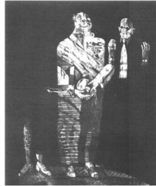
Рисунок 4. Ю. Абделки. «Люди. 13». Акватинта. 1993 г.

Картина изображает на черном фоне трех человек, обращенных лицом к зрителю, на которых художник направил свет так, чтобы их тени отражались на земле. Драматизм и экспрессионизм работы выражается в том, как мастер обработал образы своих персонажей. Это касается их поз, размеров, выражений лиц и одежды. Для этой картины Абделки черпал вдохновение в повседневной жизни. Данный стиль повторяется и в некоторых других картинах. Как будто художник демонстрирует «группу людей с замаскированными головами, актеров в поисках автора» [2, с. 7].