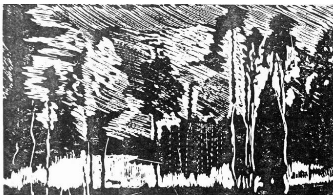
Рисунок 9. А. Сулман. «Природный Пейзаж». Линогравюра. 2001 г.

Сулман позаботился в своих других работах об эмоциональности и движении, которые чувствуются в динамике частотола линий и направлении штриховки элементов, гармонирующих с внутренним ощущением мастера, что видно в его картине «Природный Пейзаж» (Рисунок 9), исполненной в технике линогравюры. Из всего вышесказанного следует, что Сулман в рамках экспрессионизма использовал разнообразные способы построения изображений в своих гравюрах.