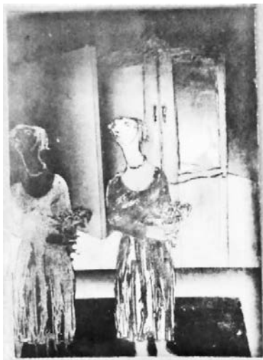
Рисунок 5. З. Даллул. «Девушка с букетом». Гравюра на металле. 1977 г.

Даллул изучал искусство гравюры в Дамаске и продолжил обучение в Париже. В своих первых работах он придерживался экспрессионистического реализма, как, например, в картине «Девушка с букетом» (Рисунок 5), исполненной в технике гравюры на металле.