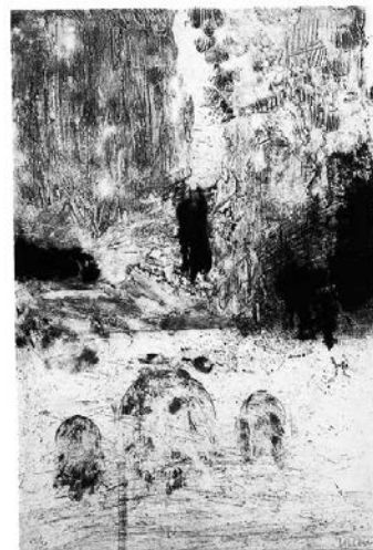
Рисунок 6. З. Даллул. «Гранада». Гравюра на металле. 1999 г.