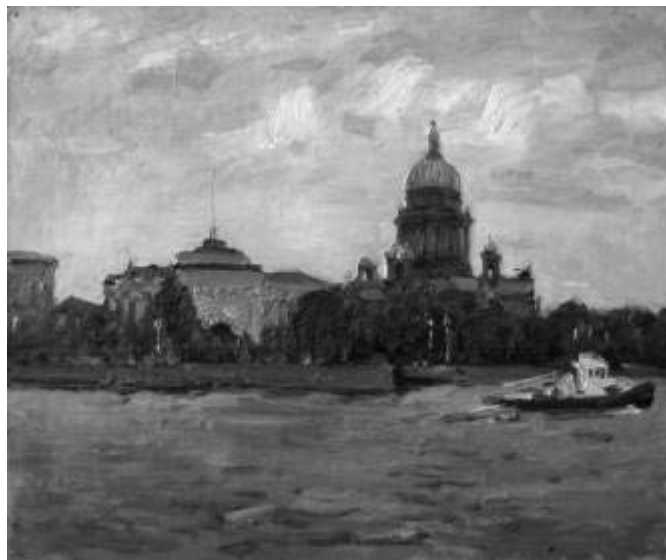
Рисунок 2. И. С. Хайрулинов. На Неве. Исаакиевский собор. 1973 г. Холст, масло. 50 x 60 см

В наше время письмо, по существу, находится за пределами художественной литературы. Но эпистолярная литература (от греч. epistole – «письмо» – литературный жанр, в котором используется форма писем, «по-сланий», письменных форм бытовой речи [11, с. 1567]) как искусство слова, несомненно, влияет на человека. Мы обращаемся к изучению писем... Бытовые, ограниченные сферой бытового общения, дружеские письма преобладают в переписке Ильбека Хайрулинова – это письма к жене, письма к сыну, знакомым и художникам-коллегам по цеху. Помимо писем «бытовых», есть письма, имеющие литературно-художественный характер, мы рассматриваем их как «художественные». Следующий тип «публицистические» – письма в редакции газет, или «открытые письма». Как письма выделяем также документы делового общения: переписку между И. С. Хайрулиновым-частным лицом и организациями, «юридические» письма. Есть «научные», они же «технические» письма – профессионально ориентированная переписка, в которой преобладает научный или профессиональный интерес художника. Есть и удивительные письма, оригинальные: так, Хайрулинов в 2014 году пишет письмо героям на Кубу, лично руководителю страны Фиделю Кастро, портрет которого он написал 50 лет назад, в 1964 году, – и получает от него ответ [14, с. 251-253]! Художник хранит фото команданте с его личной подписью.