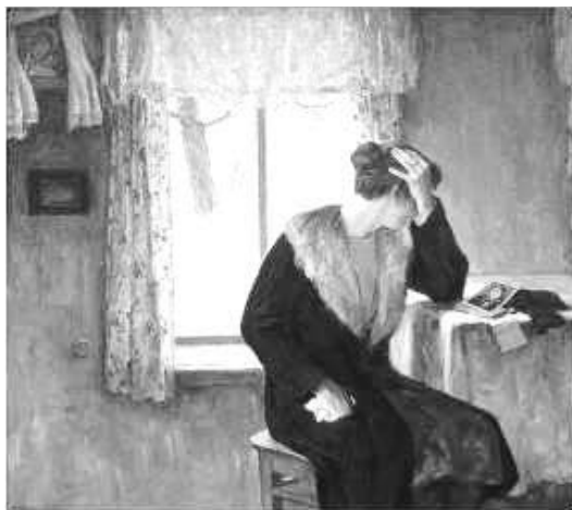
Рисунок 4. И. С. Хайрулинов. Поздняя встреча. 1996 г. Холст, масло. 136 x 150 см

над чем должен работать занимающийся искусством – оградить людей от грусти! Но жизни без грусти не бывает. Картина мастера «Поздняя встреча» (Рис. 4) перекликается с его стихами о брошенных деревнях России: «...дома без огней в дальних деревнях, матерей печаль, к ним пробивает память свою тропинку» [21, с. 83].