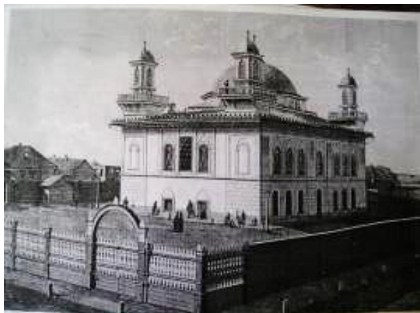
Рисунок 3. Персидская мечеть. Из коллекции старинных фотографий