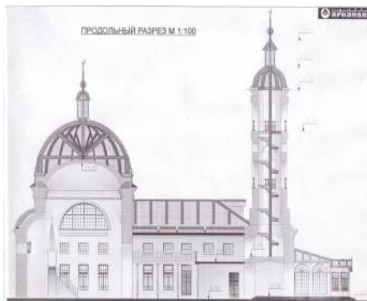
Рисунок 1. Белая мечеть.

Продольный разрез, выполненный в НИИФ «Ярконон»