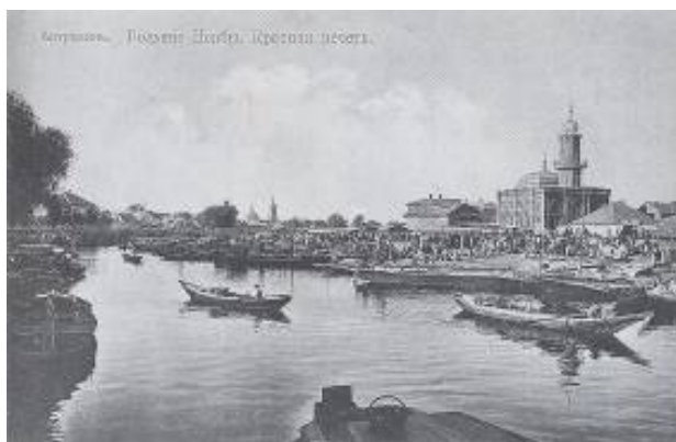
Рисунок 11. Мечеть на Больших Исадах.