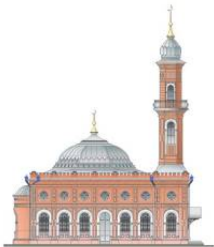
Рисунок 9. Бакы-мечеть. Западный фасад