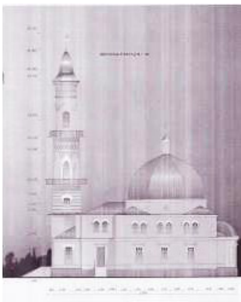
Рисунок 5. Чёрная мечеть. Восточный фасад, выполненный в НИПФ «Ярконон»