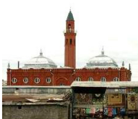
Рисунок 12. Мечеть на Больших Исадах после реконструкции. Фото 2015 г.

Подводя итоги статьи об архитектуре исторических мечетей Астрахани, отметим следующее. Во-первых, архитектура астраханских мечетей XIX – начала XX в. основана на общероссийской стилиевой и объёмно-композиционной направленности, так как их возведение регламентировалось государственными указами и предписаниями. Во-вторых, для астраханских мечетей характерны такие черты, как купольно-осевая схема постройки; вертикаль высокого ствола минарета, примыкающего к основному двухсветному объёму модельного здания, напоминающего колокольню; изящность металлического обходного балкона-шерфе; грациозность конусо-сферического купола минарета; направленный на юго-запад михраб, решённый в форме выступающего из основного объёма здания полуцилиндра. В-третьих, внутреннее пространство ряда астраханских исторических мечетей характеризуется колонной планировкой с антресольными галереями, где, как правило, находится женская часть мечети. В-четвёртых, рассмотренные мечети являются архитектурными доминантами исторических районов Астрахани (Татарская слобода, Большие Исады, район Криуши), они сумели обогатить архитектурный облик городской застройки, поддержать стилиевые характеристики своего времени, а также корректно вписаться в планировочную структуру города.