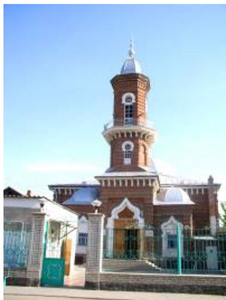
Рисунок 7. Центральная мечеть. Северный фасад. Фото 2015 г.