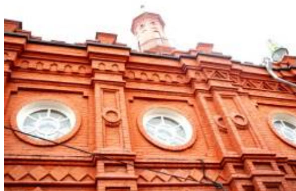
Рисунок 10. Бакы-мечеть. Фрагмент фасада. Фото 2017 г.