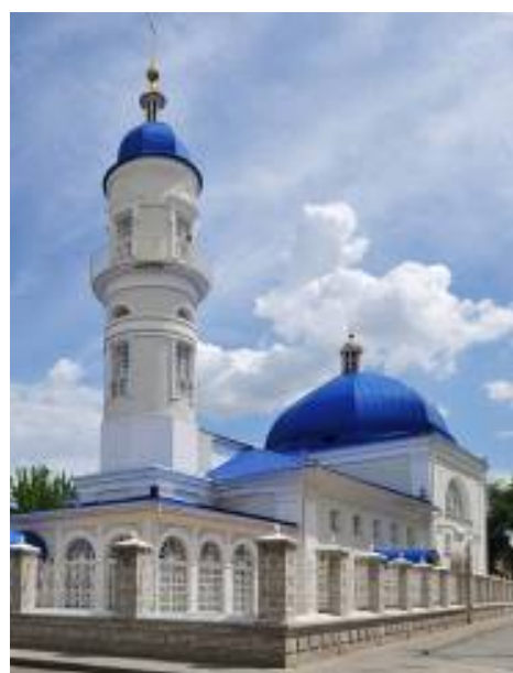
Рисунок 2. Белая мечеть.

Продольный разрез, выполненный в НИИФ «Ярконон»