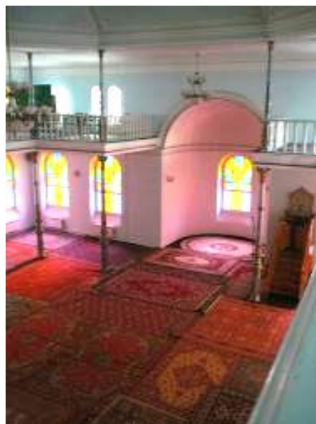
Рисунок 8. Интерьер молитвенного зала. Фото 2017 г.