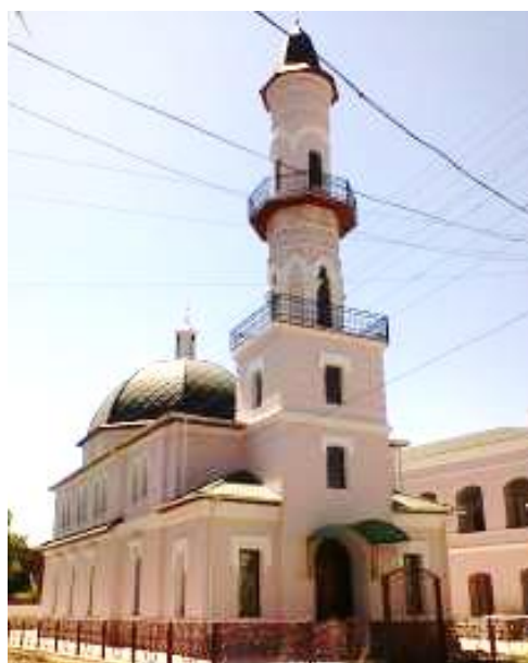
Рисунок 6. Чёрная мечеть. Северо-восточный фасад. Фото 2016 г.