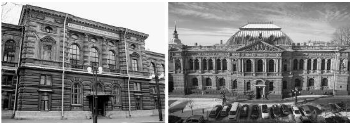
Рисунок 1. Санкт-Петербургская государственная художественно-промышленная академия им. А. Л. Штиглица: главный корпус и учебный музей прикладного искусства