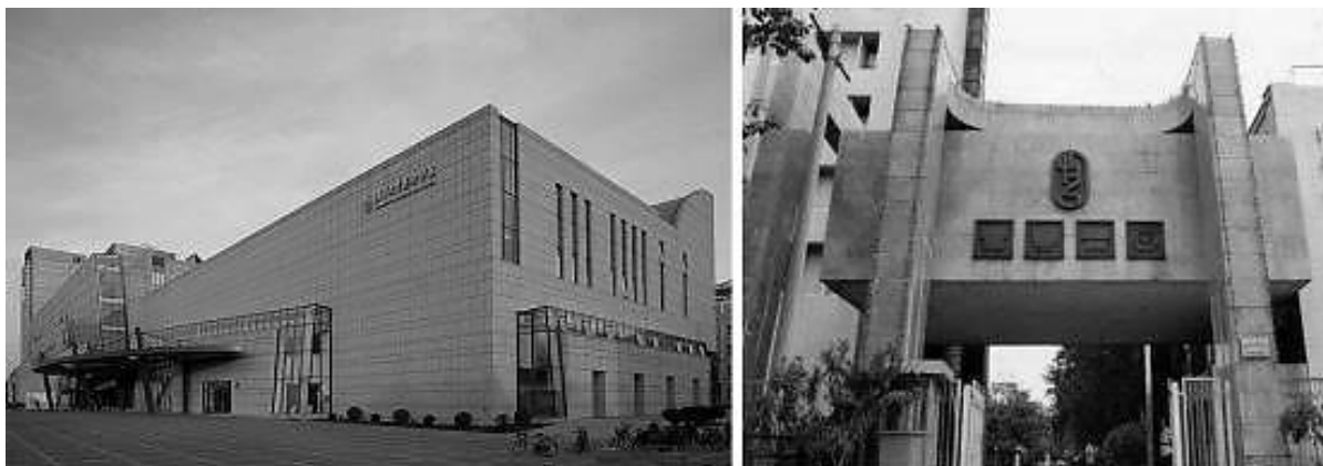
Рисунок 2. Новый и старый корпуса Академии искусств и дизайна Университета Цинхуа

Первым из высших учебных заведений, учредивших факультет художественного дизайна среды, стал Университет Цинхуа, Академия искусств и дизайна (清华大学美术学院, цинхуа дасюэ мэйшу сюэюань, Academy of Arts & Design, Tsinghua University) [24] (см. Рис. 2). До факультета художественного дизайна среды существовал факультет оформления интерьера при Центральном институте прикладного искусства (ныне Академия искусств и дизайна Университета Цинхуа), основанный в 1957 году. Факультет оформления интерьера неоднократно менял названия – архитектурного оформления, промышленного искусства, дизайна интерьера. В 1988 году специальность «дизайн интерьера» расширили, вследствие чего был создан факультет художественного дизайна среды, а название данного направления подготовки внесли в каталог программ высшего образования, изданный Государственной Комиссией по образованию КНР [19].