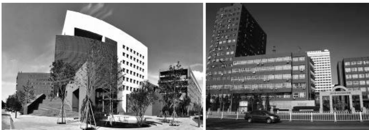
Рисунок 3. Новый и старый корпуса Института художественного дизайна Пекинского технологического университета

Факультет средового дизайна был учреждён в 1990 году на основе ранее существовавшего при данном учебном заведении факультета специального декоративно-прикладного искусства. Вначале содержание учебной программы факультета средового дизайна в основном включало в себя три аспекта: основы искусства и дизайна, творческие занятия и традиционное китайское декоративно-прикладное искусство.