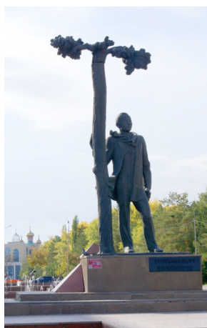
Иллюстрация 3. Памятник С. Торайгырову . Скульптор Ескен Сергебаев . Материал: бронза. Установлен 25 октября 2000 г.