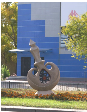
Иллюстрация 7. Торсык. Скульптор Владимир Ефремов. Материал: железобетон, чугун, стекло. Установлен в 2016 г.