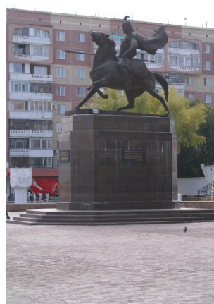
Иллюстрация 2. Малайсары батыр. Скульптор Булат Кусаинов . Материал: бронза. Установлен 20 августа 2016 г.