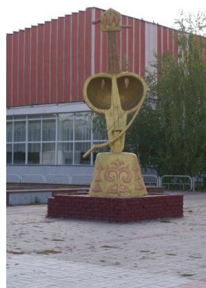
Иллюстрация 6. Кобыза. Скульптор Турар Тулеев. Материал: железобетон. Установлен в 2012 г.