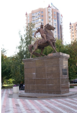
Иллюстрация 1. Баян батыр. Скульптор Едиге Рахмадиев . Материал: бронза. Установлен 12 июля 2014 г.

В контексте символической функции городской скульптуры различные города и регионы, обладая уникальными историческими, культурными и социальными характеристиками, воплощают свою идентичность через монументальное искусство. Скульптура превращается в визуальный символ, отражающий культурную специфику и историческую значимость местности. Памятники А. С. Пушкину в России стали неотъемлемыми атрибутами городского пейзажа, отображая культурные приоритеты и историческое наследие. В Павлодаре такими памятниками являются скульптуры народным героям Баян батыру (Иллюстрация 1) и Малайсары батыру (Иллюстрация 2). Они акцентируют внимание на региональной героической истории, способствуя формированию общественного самосознания. Скульптуры этих национальных героев, выступавших как освободители во время джунгарской угрозы, символизируют борьбу и защиту территорий, что важно для культурной памяти города.