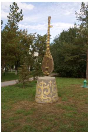
Иллюстрация 5. Домбра. Скульптор Турар Тулеев. Материал: железобетон. Установлен в 2012 г.

В контексте интеграции малых архитектурных форм в городское пространство существует проблема размещения, выражающаяся в недостаточной согласованности и понимании создаваемого образа города. Если с памятниками видных деятелей нет такой проблемы, то, например, скульптура домбры (Иллюстрация 5), расположенная на входе в сквер, не формирует смысловую и композиционную связь с общим пространством сквера, оставаясь изолированной. Минималистичный дизайн окружающих лавочек, клумб, фонтанов и фонарей не поддерживает национального колорита, который предполагалось создать установкой домбры. С другой стороны, скульптура другого музыкального инструмента, кобыза (Иллюстрация 6), размещенная возле музыкального колодеджа, тематически гармонирует с местом своего расположения. Однако новый прямоугольный фонтан, заменивший старый неправильной формы со скульптурой музы в национальном колорите, нарушает эту гармонию, разрушая созданную ранее камерную атмосферу отсутствием композиционной целостности.