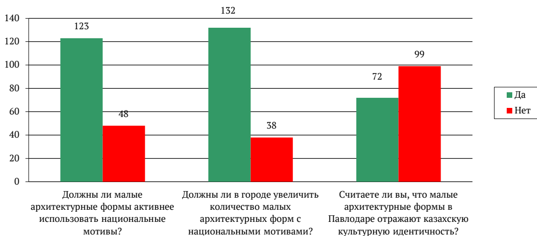
Диаграмма 2. Данные онлайн-опроса жителей г. Павлодара по вопросам малых архитектурных форм с национальными мотивами в городской среде

Затем в анкетировании следовали три схожих вопроса, однако каждый из них имел свое уникальное содержание и различную смысловую нагрузку (Диаграмма 2).