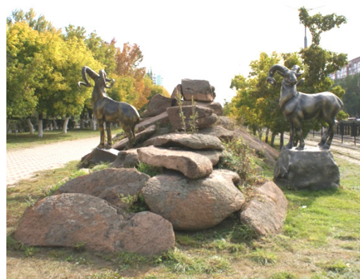
Иллюстрация 8. Баянаульские архары. Типовая скульптура, массовое производство. Материал: чугун, стеклопластик. Установлен в 2016 г.

На проспекте им. Н. Назарбаева более удачное решение демонстрируется установкой скульптуры торсык (торсык – казахская национальная посуда из натуральной кожи) (Иллюстрация 7) напротив скульптур баянаульских архаров (архар – подвид горного барана, занесенный в Красную книгу Казахстана) (Иллюстрация 8),