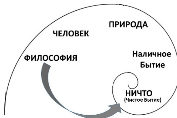
Рисунок 1. Схема онтологии по Г. В. Ф. Гегелю