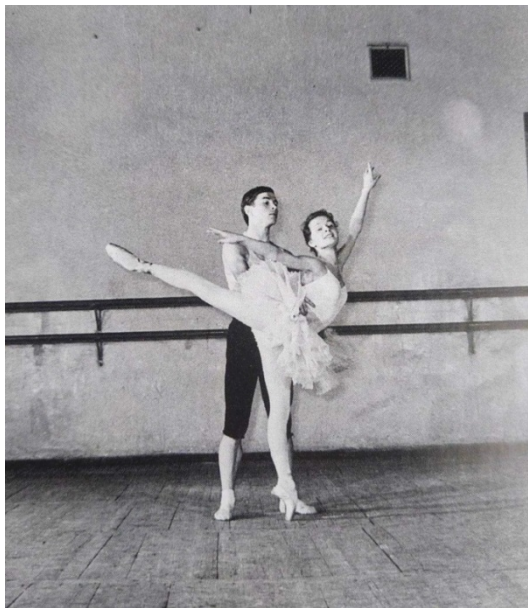
Фотография 3. Рудольф Нуреев и Алла Сизова на репетиции. Ленинград, 1958 г.