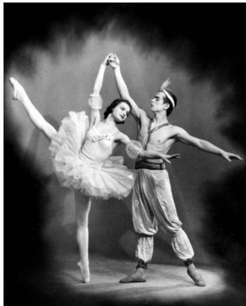
Фотография 4. Рудольф Нуреев и Алла Сизова