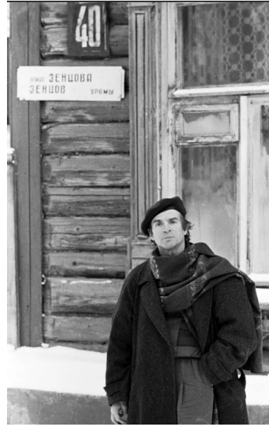
Фотография 6. Рудольф Нуреев в Уфе, 1987 г.