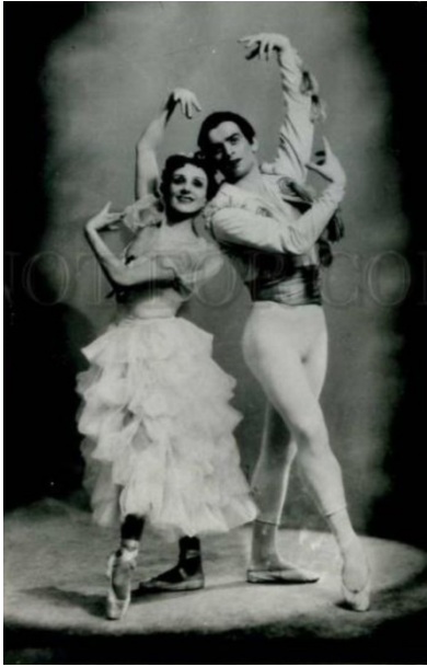
Фотография 5. Рудольф Нуреев и Наталья Дудинская, 1958 г.

Лишь в конце 80-х годов Нуреев приезжает в Россию. В 1987 году ему разрешили въезд в страну на 72 часа для свидания с умирающей матерью в г. Уфе (Фотография 6).