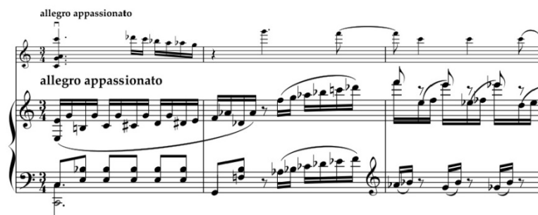
Пример 2. I часть, главная тема

Сразу после главной партии появляется двухтактовый начальный мотив вступления ( a tempo moderato ), который плавно перетекает в связующую партию. Повторяющаяся интонация восходящей секунды с чередованием опорного тона ( h-c-b-c ) в мелодическом голосе, поддержанная волнообразными фигурациями, постепенно раскручивается и в стремительном движении accelerando мгновенно достигает максимальной звучности. В кульминационном моменте нисходящие пассажи скрипки противопоставляются восходящим пассажам фортепиано.