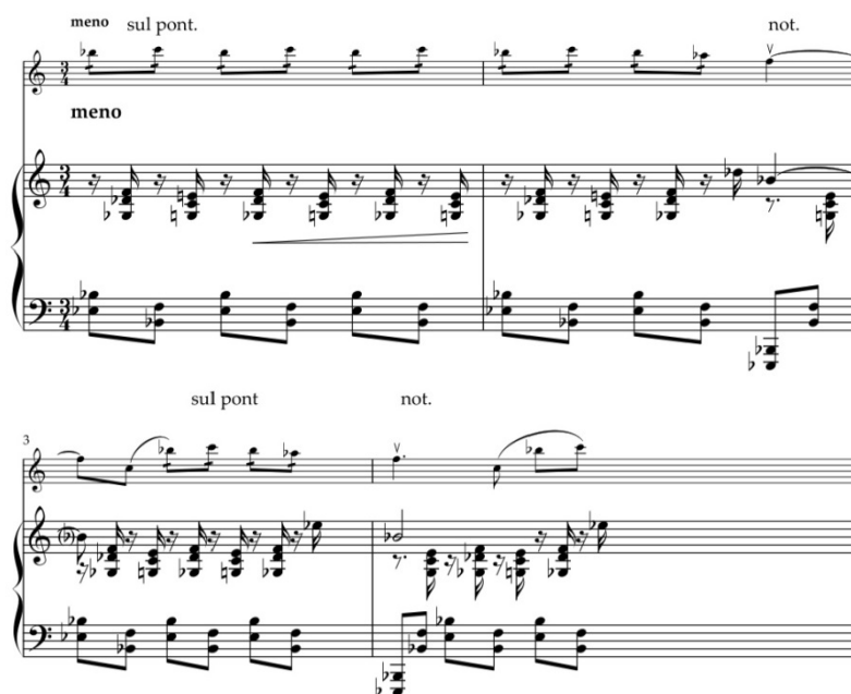
Пример 3. I часть, побочная тема

Заключительная партия построена на вопросительных интонациях скрипки из вступления, в аккомпанементе – трепетные фигурации на фоне мягко звучащего басового голоса в низком регистре.