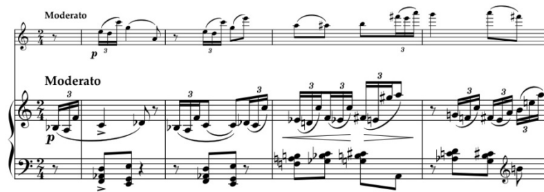
Пример 8. IV часть, основная тема