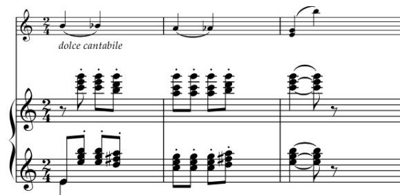
Пример 10. IV часть, средний раздел

В дальнейшем развитии второй мотив значительно трансформируется и предстает в совершенно ином облике. Мелодия переходит из низкого регистра в первую октаву, приобретая более напевный характер, и звучит теперь у фортепиано с аккомпанирующей поддержкой скрипки на pizzicato . В небольшом среднем разделе вновь солирует струнный инструмент на фоне аккордового staccato , выписанного в высоком регистре и с соответствующим авторским указанием dolce cantabile . Возникает воздушно-трепетный и хрупкий образ, который соотносится со сферой возвышенного, и его можно трактовать как мечту или надежду (Пример 10).