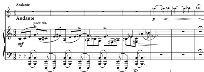
Пример 7. IV часть, вступление

Композиция IV части представляет собой сложную трехчастную структуру, сочетающую в себе черты сонатной и концентрической формы. В начале финала звучит вступление, тема которого первоначально изложена в фортепианной партии. Неторопливо разворачивающаяся мелодия в виде восходящих триольных фигураций вуалирует полутоновое движение верхних нот. Их акцентирование вместе с синкопированными октавами басовой линии вносит некий дисбаланс в метроритмическом восприятии темы, размывая ощущение сильной доли в такте (Пример 7). Выдержанные восходящие секунды скрипки сначала вторят фортепиано, а затем на волне динамического подъема в ее партии появляются интонации основного тематического материала.