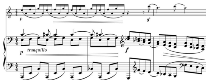
Пример 6. III часть, побочная тема

фортепиано и поддерживается размеренно-покачивающимся аккомпанементом. Возникающий на его многократном повторении динамический подъем завершается стремительно-ниспадающим аккордовым движением у фортепиано и надрывными возгласами скрипки (Пример 6).