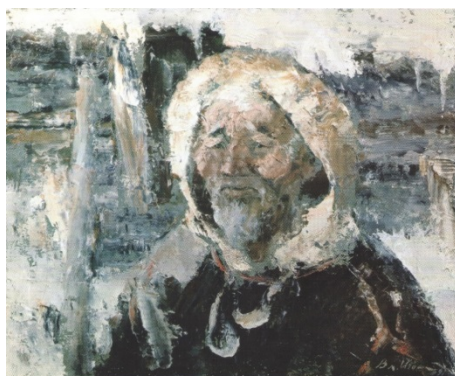
Иллюстрация 13. В. А. Игошев. Ровесник века. 1991. Фанера, масло. 65 x 80. Частное собрание. Владимир Игошев: альбом. М.: Фонд поколений, 1997

«Роман Ойка», 1990; «Ровесник века», 1991). Здесь он прибегает к оптическому принципу, размывая пейзажную среду вплоть до едва распознаваемых красочных сгустков, как, например, в картине «Ровесник века» (Иллюстрация 13). В некоторых портретах В. А. Игошев сознательно обращается с масляными красками как с субстанцией, позволяющей формировать впечатляющий рельеф фигуры на фоне растворяющихся очертаний предметно-природного мира.