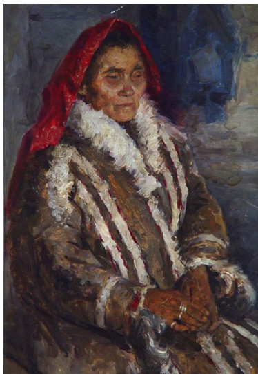
Иллюстрация 6. В. А. Игошев. Старуха манси . 1954. Картон, масло. 50 x 35. Нижнетагильский музей изобразительных искусств. Государственный каталог Музейного фонда РФ