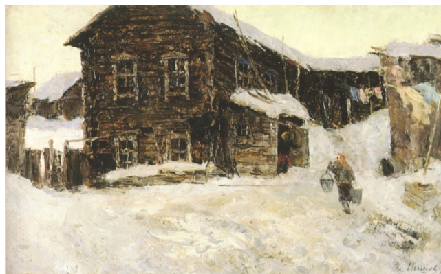
Иллюстрация 9. Дом охотника Рокина. 1974. Картон, масло. 50 x 80. Музей Природы и Человека. Государственный каталог Музейного фонда РФ

Поэтика уходящего мира – «седого», мудрого Севера – затронула, казалось бы, далекие от темы старости изобразительные жанры. В таких элегических, жанровых пейзажах, как «Старая школа в Няксимволе» (1973), «Дом охотника Рокина» (1974) (Иллюстрация 9), В. А. Игошев сознательно делает акцент на неприглядных, нерепрезентативных вещах и явлениях маленького мансийского поселка, подчеркивая их ветхость, но и органичную соразмерность неизменному природному циклу. Сложно представить подобный взгляд в 1950-е годы, когда автором, напротив, или выделялись приметы «новой жизни» (вспомним, например, что на картине «В праздничный день» шумная компания молодых людей предается веселью на фоне строящихся домов), или же истолковывались в прогрессистском духе явления «старого Севера». Писатель Василий Белов верно отметил новое качество живописи художника: «Очень мне дорого в Игошеве то, что он никогда не идеализирует людей в портретах, не стремится их приукрасить. И природу Игошев не приукрашивает. Снег так снег. Мороз так мороз. Стареет “Дом охотника Рокина” – значит, стареет! Правда во всем» (2006, с. 8).