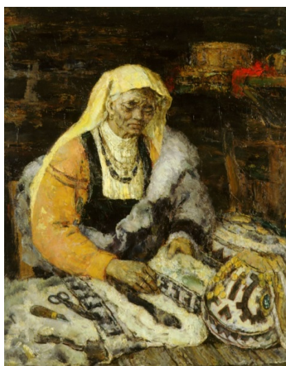
Иллюстрация 14. В. А. Игошев. Таежные узоры. 1989. Холст, масло. 125,7 x 100. Государственный художественный музей. Государственный каталог Музейного фонда РФ

Интерес вызывают жанровые ракурсы и мотивы, выбранные мастером для художественного воплощения темы старости. Например, в «Таежных узорах» (Иллюстрация 14) он «стремился создать собирательный образ пожилой мансийской женщины, соединив впечатления от разных моделей» (Дом-музей..., 2003, с. 10). Перед нами не просто изображение пожилой мансийской женщины, а именно образ женщины-творца, шьющей сахи ( меховую шубу), ибо она «ставила перед собой художественную задачу, обдумывала ее, намечала пути решения и потом безошибочно исполняла» (Дом-музей..., 2003, с. 10). Восхищение автора творениями мансийской рукодельницы ощущается в притягательной маэстрии колорита, построенного на сочетании сближенных по тону коричневатых, охристо-серебристых и лимонно-оранжевых оттенков и дополненного изумрудными (осколок стекла) и красными (материя в углу картины) пятнами-репликами. Фактура меха от соприкосновения человеческих рук, излучающих тепло, буквально оживает на наших глазах, наполняется разными по силе рефлексам.