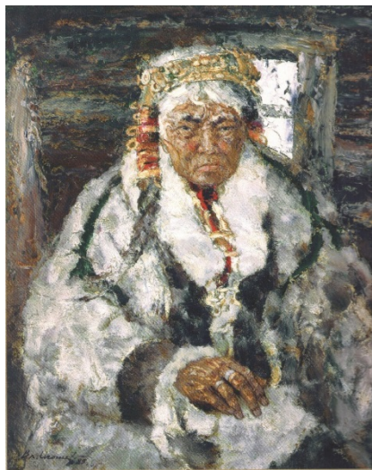
Иллюстрация 10. В. А. Игошев. Хранительница северных легенд . 1989. Картон, масло. 105 x 86. Частное собрание. Владимир Игошев: альбом. М.: Фонд поколений, 1997

Все последующие произведения В. А. Игошева, относящиеся к теме старости, через богатейшие возможности реалистического языка стремились сохранить ауру древности и изначальности мансийского быта. Закономерно, что наглядными образцами неповторимости и аутентичности Севера, хранителями традиций выступали старики и старухи. Последние представлены в полотнах художника в качестве уходящей природы, которой не коснулись пагубные процессы форсированной модернизации («В старинном наряде», 1989; «Старый вогул», 1989; «Хранительница северных легенд», 1989; «Хранительница северных былин», 1991). Как и писателей-«деревенщиков», изображавших мир коренных народов Сибири (В. П. Астафьев, В. Г. Распутин), В. А. Игошева притягивает не «советская» с местным оттенком идентичность, а прежняя, созданная архаичным культурным опытом» (Разувалова, 2015, с. 407). Уже названия упомянутых полотен – «Хранительница северных легенд» (Иллюстрация 10), «Хранительница северных былин» – вовсе не случайны, так как отражают понимание художником сакральной роли стариков и старух. По словам М. А. Лапиной (2008, с. 54), пожилая женщина у обских угров могла участвовать в священнодействиях и жертвоприношениях, петь священные песни и рассказывать легенды, мифы о происхождении рода.