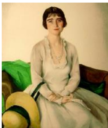
Иллюстрация 2. С. А. Сорин «Портрет королевы Елизаветы Боуз-Лион» (1923). Лондон, Великобритания, St James's Palace, St. James's