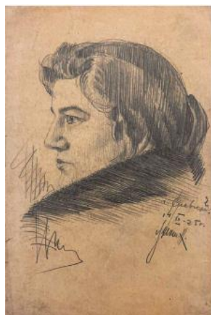
Иллюстрация 8. Г. Г. Ликман «Женский портрет» (14 декабря 1925 г.). Собрание А. В. Ковалева

В «Женском портрете» (14 декабря 1925 г.), выполненном карандашом, Г. Г. Ликман, подобно А. Древину, использует лаконичные средства для передачи глубокого психологизма (Иллюстрация 8). Центральным элементом композиции является выразительный взгляд героини. Этот взгляд, направленный за пределы листа, глубокий и яркий, устанавливает психологический контакт со зрителем, призывая задуматься о настроении и личности изображаемой.