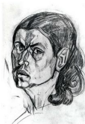
Иллюстрация 5. А. Древин «Портрет Надежды Удальцовой» (1923). Частное собрание

Художник подчёркивает в портрете Надежды Удальцовой строгое выражение лица: нахмуренные брови, прямой и пристальный взгляд на зрителя, слегка разомкнутые губы с опущенными уголками передают внутреннюю силу и сосредоточенность, но также и некоторую замкнутость изображаемой. Поза с лёгким поворотом головы подтверждает это, делая образ сосредоточенно открытым. Резкие, угловатые линии и контрастные тени, чётко прорисованные скулы и подбородок указывают на волевой характер и сложную внутреннюю жизнь Надежды Удальцовой. Сочетание мягкости в чертах лица и жёсткости в линиях и неравномерная штриховка свидетельствуют о глубоком и сложном внутреннем мире творческой натуры Надежды Удальцовой.