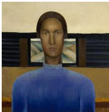
Иллюстрация 9. А. А. Лепорская «Псковитянка» (1934). Государственный Русский музей

Произведение «Псковитянка» занимает особое место в истории психологического портрета 1930-х годов. В нём прослеживается принципиальный сдвиг: вместо акцента на индивидуальных чертах художник создаёт обобщённый, архетипический образ.