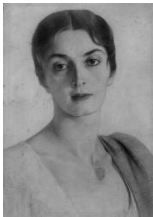
Иллюстрация 1. С. А. Сорин «Портрет княжны Мэри (Марии Прокофьевны Эристави-Ширвашидзе)» (1920). Частное собрание