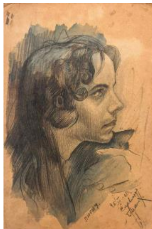
Иллюстрация 7. Г. Г. Ликман «Лигия» (25 декабря 1925 г.). Собрание А. В. Ковалева

В «Женском портрете» (14 декабря 1925 г.), выполненном карандашом, Г. Г. Ликман, подобно А. Древину, использует лаконичные средства для передачи глубокого психологизма (Иллюстрация 8). Центральным элементом композиции является выразительный взгляд героини. Этот взгляд, направленный за пределы листа, глубокий и яркий, устанавливает психологический контакт со зрителем, призывая задуматься о настроении и личности изображаемой.