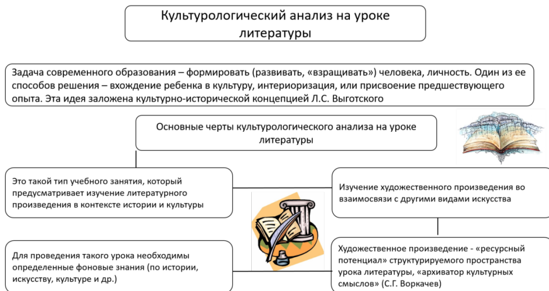
Рисунок 1. ОКС для подготовки лабораторно-практического занятия «Использование культурологического анализа на уроке литературы»

Исходя из вышеизложенного, на лабораторно-практическом занятии с целью структурирования и визуализации материала можно применять опорную конспект-схему (ОКС) «Использование культурологического анализа на уроках литературы» (Рис. 1). В представленной схеме даны психолого-педагогические основания включения ребенка в пространство культуры, базирующиеся на культурно-исторической концепции Л. С. Выготского (Бережковская, 2023), а также структурно обозначены те черты культурологического анализа, которые целесообразно использовать на уроках литературы в основной и средней школе, делая акцент на изучении художественного произведения в контексте истории, культуры, искусства, воспринимая литературный текст источником культурных смыслов и ресурсов (Воркачев, 2020).