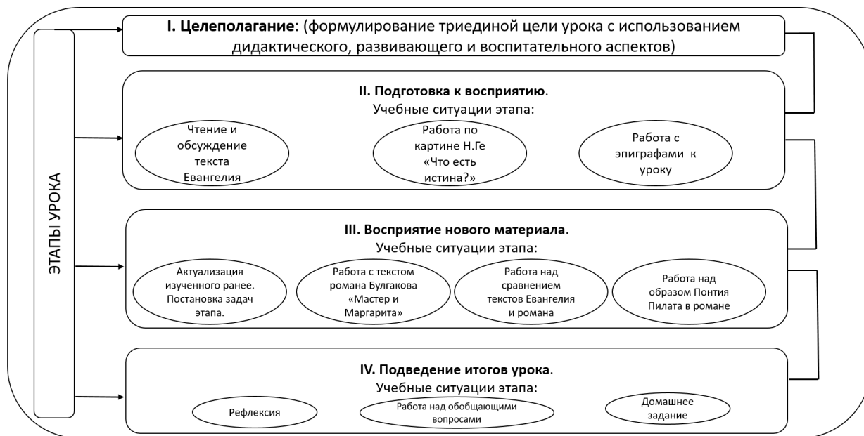
Рисунок 2. Схема-модель урока изучения романа М. А. Булгакова «Мастер и Маргарита» с использованием элементов культурологического анализа

Модель урока изучения художественного произведения с использованием элементов культурологического анализа