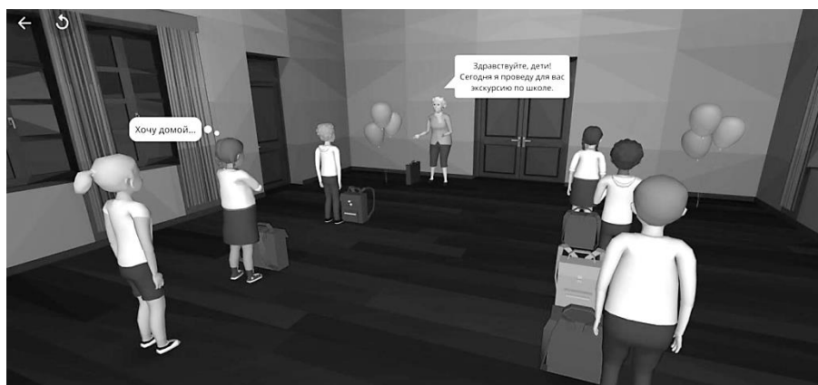
Рисунок 1. Пример 3D-модели урока по дисциплине «Адаптация первоклассника»

На Рисунке 1 проводится урок в рамках темы «Правила школы», целью урока явилась первичная адаптация первоклассника к новой обстановке, разработанный будущим учителем фрагмент урока представляет собой начало проведения экскурсии по школе.