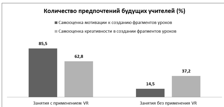
Рисунок 3. Предпочтения будущих учителей в самооценке мотивации и креативности применения технологии виртуальной реальности

Далее на Рисунке 3 представлены результаты самооценки будущих учителей по показателям мотивации и креативного компонента создания фрагмента уроков на занятиях с применением и без применения VR-технологий, что было отражено в результате опроса.