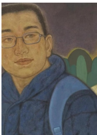
Иллюстрация 4. Сяо Шунь. Ученическая работа «Ночь». 2024 г. Частное собрание