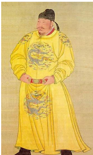
Иллюстрация 1. Портрет императора Тайцзуна династии Тан. Династия Тан. Национальный дворец-музей в Тайбэе