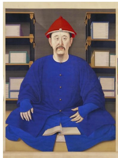
Иллюстрация 2. Портрет императора Канси за чтением. Династия Цин. Дворцовый музей

С течением времени в связи со сменой династий художественная форма портрета в китайской живописи незначительно, но менялась. Она могла отражать актуальные вкусы, смену в эстетических и даже философских представлениях, а в случае с изображениями знати еще и динамичную политическую обстановку. Доктор изящных искусств, художник и доцент Школы искусств Нанкинского политехнического университета Цзэн Цзя при чтении лекций по истории портретной живописи будущим художникам и дизайнерам сопоставляет портреты западноевропейской школы, а также русских передвижников с образами, созданными китайскими мастерами. Она показывает, чем отличаются, например, «Девушка с жемчужной сережкой» Яна Вермеера и «Незнакомка» И. Н. Крамского, а также два знаковых для Китая произведения – танский «Портрет императора Тайцзуна» (Иллюстрация 1) и цинский «Портрет императора Канси за чтением» (Иллюстрация 2).