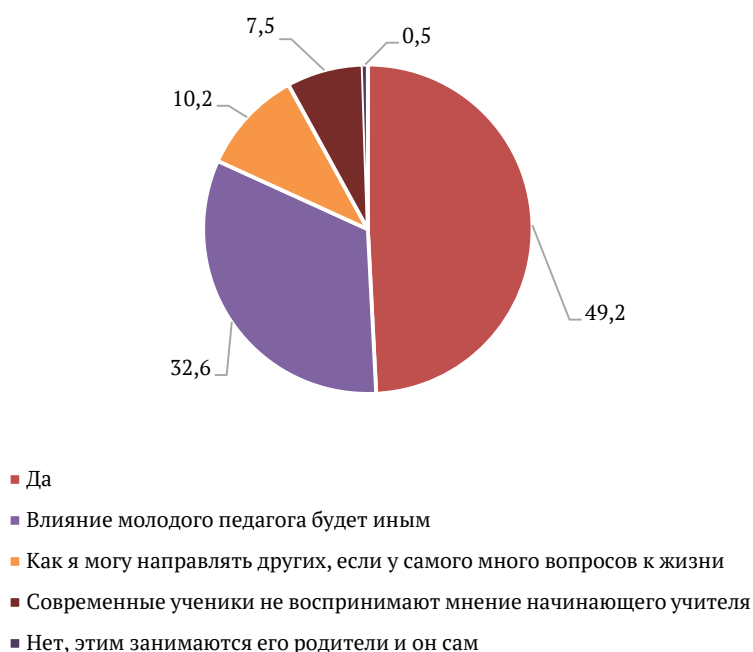
Рисунок 2. Анализ ответов будущих учителей и молодых педагогов на вопрос «Может ли начинающий педагог влиять на духовно-нравственное развитие ученика?» (%)

Следующая проблема, которая затронута в нашем исследовании, касается вопроса о возможности влияния начинающего педагога на духовно-нравственное развитие ученика. Результаты диагностики показаны на Рисунке 2.