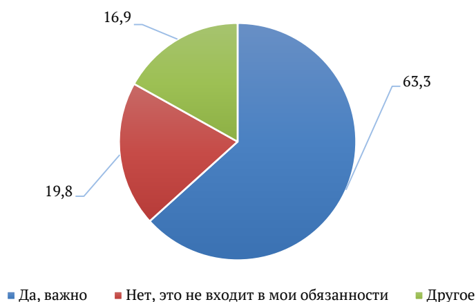
Рисунок 3. Анализ ответов респондентов на вопрос «Важно ли учителю уметь формировать чувство долга, патриотизм, честь, совесть, справедливость, сострадание и любовь к ближнему?»

Для нас важно было проанализировать мнение молодых специалистов, которые оставили свои комментарии, соответствующие их мировоззрению и пониманию задач государственной политики в области образования, а именно формирования гражданской позиции и патриотизма, что требует от самого учителя овладения не только методической культурой выстраивать современный урок, но и способности формировать у себя определенные ценностные ориентиры (Сороковых, Старицына, 2024). Представим результаты, показывающие отношение студентов и начинающих учителей к задачам патриотического и гражданского воспитания на уроке, что отражено на Рисунке 3.