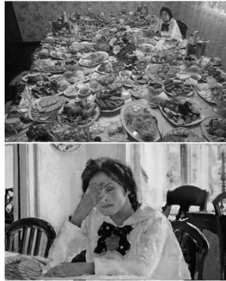
Рисунок 2. Интернет-мем № 2

ЕС продлит экономические санкции против России еще на полгода