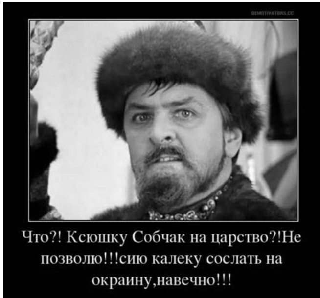
Рисунок 1. Интернет-мем № 1

ЕС продлит экономические санкции против России еще на полгода