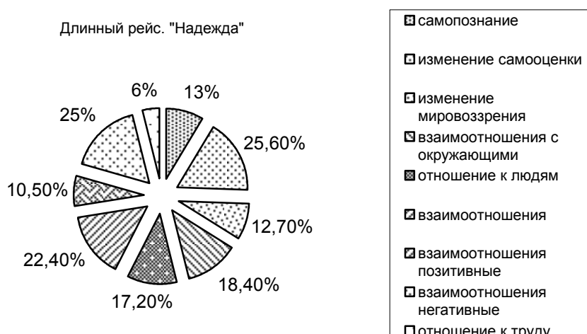
Рис. 3. Процентное соотношение составляющих личностной сферы курсантов судомехаников ПУС «Надежда»

Общим положительным моментом является выделение и первой и второй группой курсантов категории «отношение к труду». Курсанты 2 группы в кратковременном рейсе не выделяют для себя изменение самопознания и мировоззрения. Если представлять результаты в виде сравнительной круговой диаграммы, то мы получим следующую картину категорий (составляющих) личностной сферы (Рис. 3, 4):