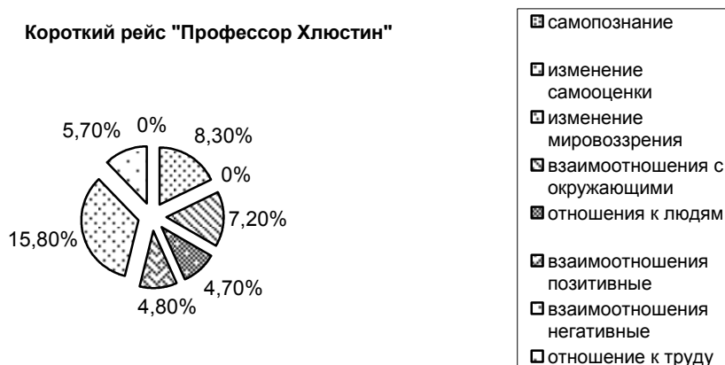
Рис. 4. Процентное соотношение составляющих личностной сферы курсантов-судомехаников «Профессор Хлюстин»

В качестве ключевого вопроса при анкетировании курсантов судомехаников механиков обеих групп выясняющий решение о дальнейшей работе, был сформулирован следующий вопрос: «Хотел бы я дальше работать по своей специальности?».