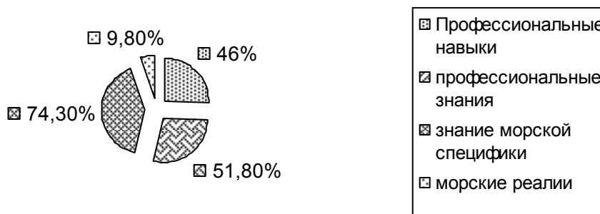
Рис. 2. Процентное соотношение составляющих профессиональной сферы курсантов-судомехаников учебного судна «Профессор Хлюстин»

б) Личностная сфера: Длительный рейс дает «самопознание» (0,688; 13%), «изменение мировоззрения» (0,55 бит; 12,7%). Значимы для курсантов 1 группы «взаимоотношения с окружающими» (0,968 бит; 18,4%), «отношение к людям» (0,722 бит; 17,2%), «взаимоотношения» (0,937 бит; 22,4%), «взаимоотношения позитивные» (0,45 бит; 10,5%), «взаимоотношения негативные» (1,076 бит; 25%), «отношение к труду» (0,252 бит; 6%). В кратковременном рейсе происходит «изменение самооценки» (0,357 бит; 8,3%), «взаимоотношения с окружающими» (0,299 бит; 7,2%), «отношения к людям» (0,186 бит; 4,7%), «взаимоотношения позитивные» (0,186 бит; 4,8%), «взаимоотношения негативные» (0,543 бит; 15,8%), «отношение к труду» (0,226 бит; 5,7%). Категорий «самопознание» и «изменение мировоззрения» нет.