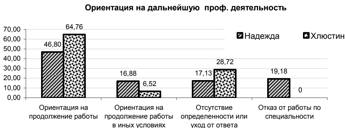
Рис. 5. Процентное соотношение результатов контент-анализа категории «Ориентация на дальнейшую деятельность».

Ориентация на продолжение работы: «да», «я себя больше нигде не вижу», «я рад, что не судоводитель», «я решил продолжить морскую деятельность», «не жалею, что выбрал эту специальность», «охотно»; ориентация на продолжение работы в иных условиях: «не на длительные рейсы», «где хорошая зарплата», «не здесь»; отсутствие определенности: «пока не знаю», «поживем-увидим», «наверное» «наверное, да»; отказ от работы по специальности: «нет», «вообще, не очень», « решил, что не буду ходить в море» (Рис. 4).