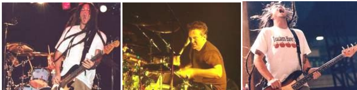
Рис. 1. Творчество музыкальной группы Deftones [2]

Источниками творчества дизайнера могут являться: явления природы, животный мир, изобразительное искусство, архитектура, художественная литература, музыка и т.д. Под влиянием окружающей действительности у дизайнера возникают ассоциации, которые трансформируются в новые формы одежды. Источником вдохновения для создания коллекции моделей женской одежды явилось творчество музыкальной группы Deftones (Рис. 1).