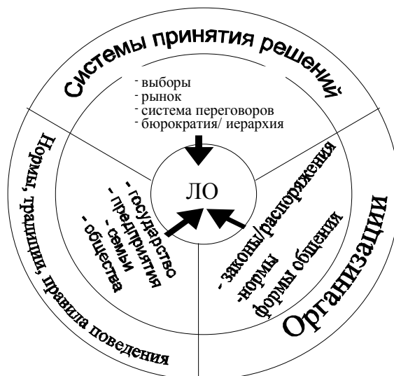
Схема 1. Виды институтов (ЛО – Лесная отрасль)

Особое внимание вопросам институционального устройства, закономерностям формирования и развития институциональной структуры стали уделять только в последние несколько лет. А первые подробные исследования влияния институтов на экономическое развитие были уже представлены в работах таких представителей институциональной школы как Д. Норт, Р. Коуз, Д. Бьюкенен и др. В сфере теории и практики институциональных изменений на сегодняшний день проделана сложная и емкая работа. Становится ясно, что именно от степени институционального благополучия зависит уровень и эффективность экономического развития, институциональные преобразования являются основой всех экономических и социальных процессов. Следовательно, вопрос формирования институциональной структуры, регулирующей процессы развития любой отрасли и Лесного комплекса в частности, один из самых актуальных на национальном, региональном и персональном уровнях.