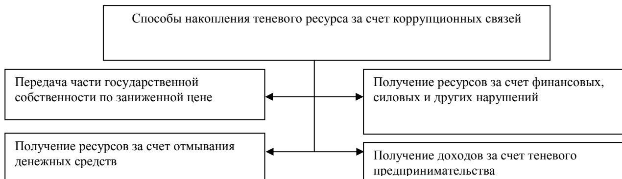
Рис. 1. Схема способов накопления ресурсов предназначенных для теневого оборота

Выделенные нами способы использования легальных ресурсов для накопления теневого ресурса путем ввода его в теневую оборот, ведут к увеличению доли теневого сектора в экономике государства. Можно видеть, что теневые сделки, совершаемые любым из представленных нами возможных способов накопления теневого ресурса, имеют коррупционный характер. Способы, применяющиеся в процессе накопления теневого ресурса, представим схематично на Рисунке 1.