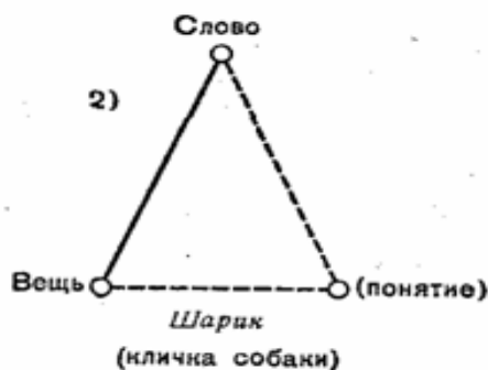
Рис. 2. Вариант треугольника Г. Фреге

Частный вариант треугольника Г. Фреге, который рассматривает строение знака ИС: