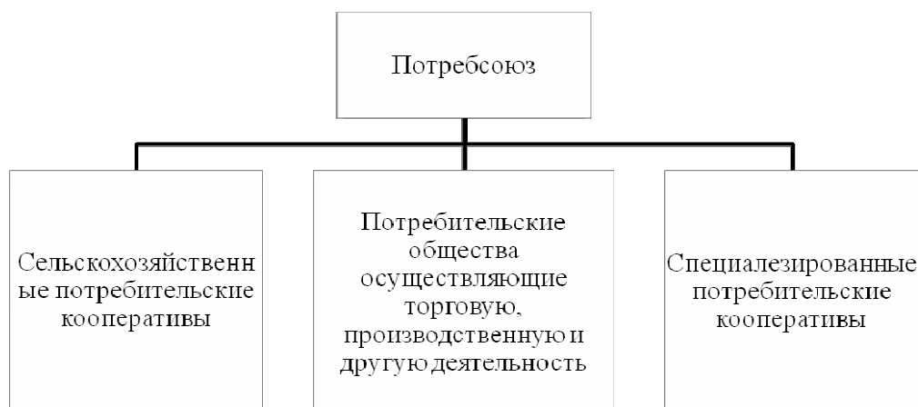
Рис. 2. Структура потребсоюза (республиканского, краевого, областного)

Субъектом управления выступает потребсоюз, и соответственно объектами управления, являются потребительские кооперативы. Потребительские кооперативы специализируются на отдельных направлениях предпринимательской деятельности. Согласно законодательству в Российской Федерации потребительские кооперативы имеют три разновидности. Структура потребсоюза (республиканского, краевого, областного) представлена на Рис. 2.