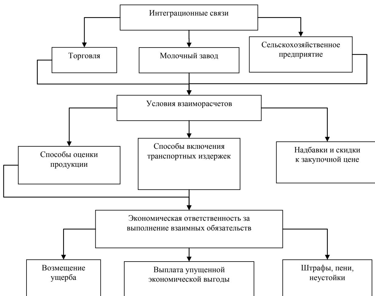
Рис. 2. Блочная модель интеграционных связей между партнерами