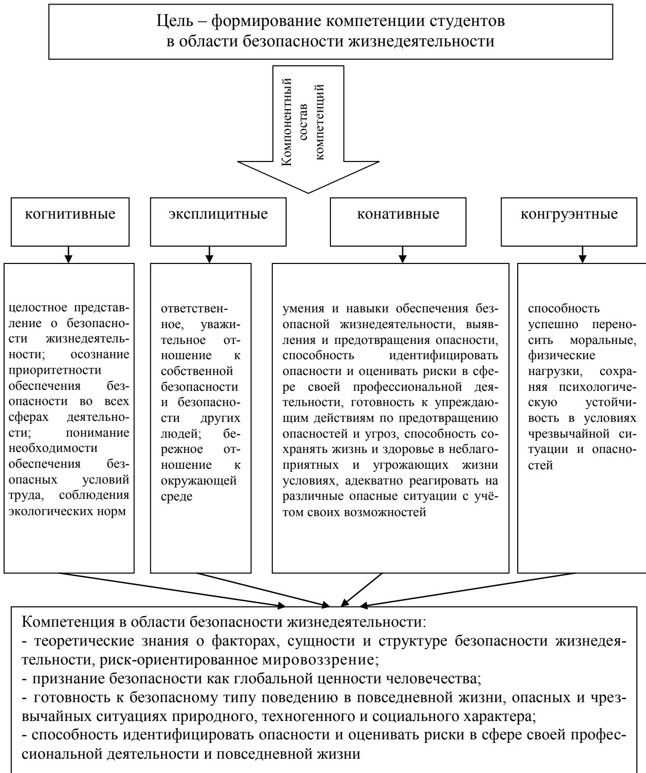
Рис. 1. Структурная модель компетенции студентов в области безопасности жизнедеятельности

Исходя из цели и задач, курс может состоять из следующих блоков: «Безопасность как фактор устойчивого развития общества» и «Обеспечение личной, общественной безопасности и безопасности государства».