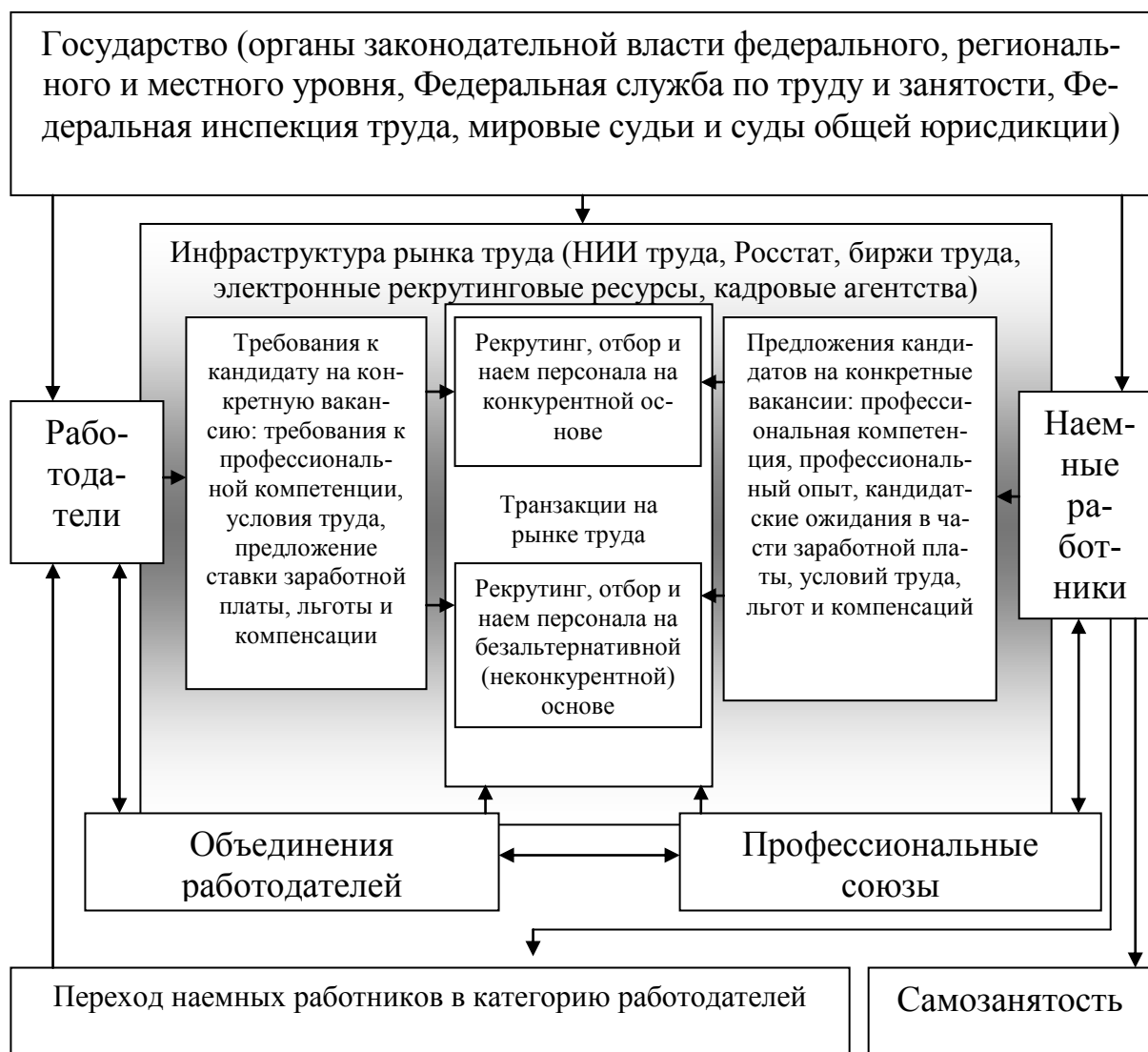
Рис. 4. Структура рынка трудовых ресурсов, учитывающая реализацию принципа конкуренции при организации социально-трудовых отношений (разработано автором)

Непосредственным предметом функционирования рынка трудовых ресурсов являются транзакции (сделки) по купле-продаже способности к труду между работодателями, предъявляющими определенные требования к профессиональной компетенции кандидата на конкретную должность, предлагающих определенные условия труда и ставку заработной платы, льготы и компенсации, и работодателями предлагающими свое видение этих условий сделки. Результатом торга становится трудовой договор, отражающий правоотношения сторон в части купли-продажи рабочей силы, разновидностью которого являются индивидуальные и коллективные трудовые договоры.