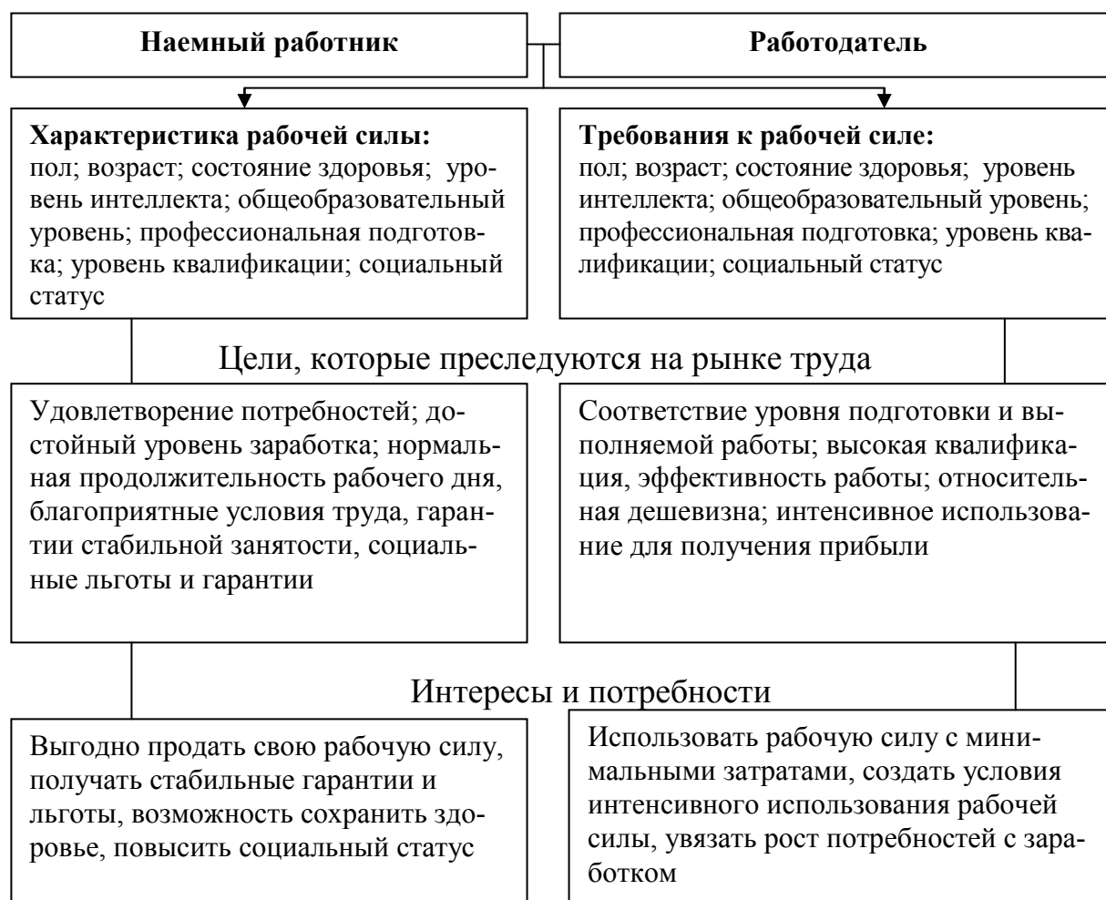
Рис. 2. Цели, интересы и потребности субъектов на рынке труда