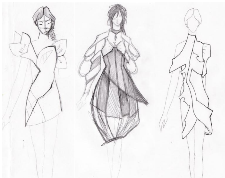
Рис. 2. Фрагмент творческой работы над проектом «Береза» (автор Е. В. Жеребцова)

Фрагмент творческой работы, выраженной в виде моделей одежды из логического ряда, представлен на Рис. 2. Логический ряд моделей представлен в виде эскизов женских платьев и костюмов, состоящих из жакета и юбки.