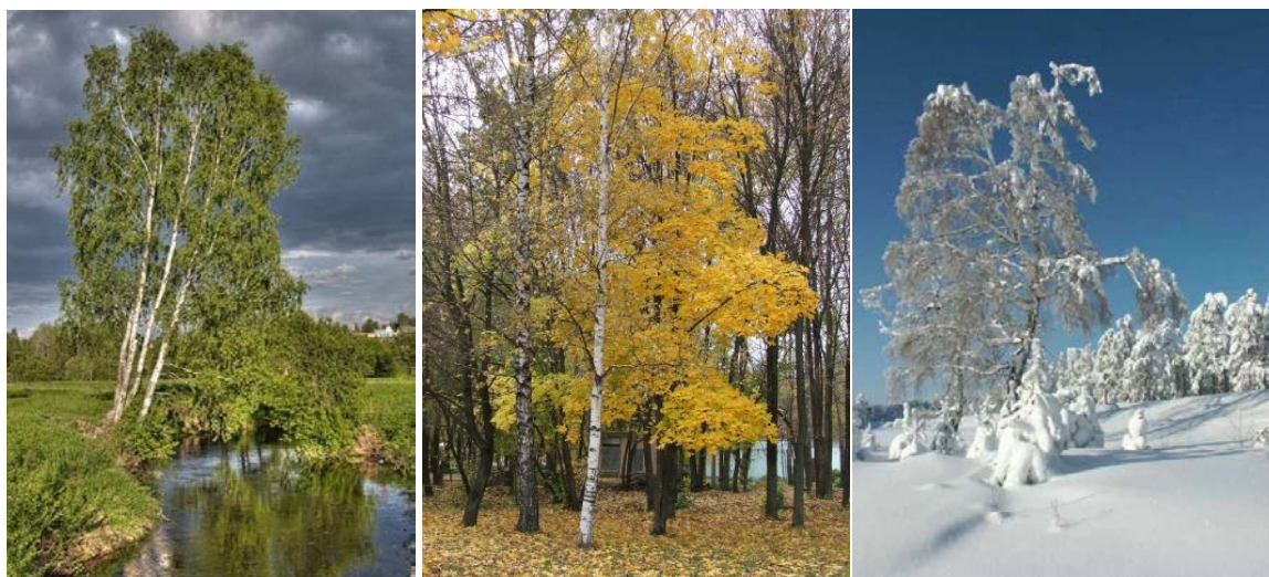
Рис. 1. Природные мотивы в разное время года [1]

В старинных славянских поверьях отношение к берёзе было двойственным: согласно одним традициям дерево и изделия из него, в том числе из бересты, считались оберегом от нечистой силы; в частности, берёзовые веники, использовавшиеся в бане, рассматривались и как инструменты ритуального очищения, а накануне Ивана Купалы берёзовые ветки втыкали над дверью, чтобы нечистая сила не проникла в дом [1].