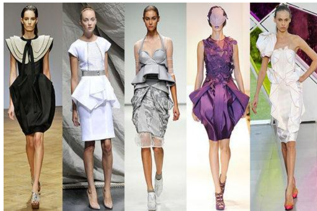
Рис. 2. Необычные геометрические формы (складки оригами), представленные в авторских моделях трехмерной одежды

Геометрическая форма костюма соответствует внешней форме тела человека, гармонично сочетается с цветом, фактурой материалов и отделкой.