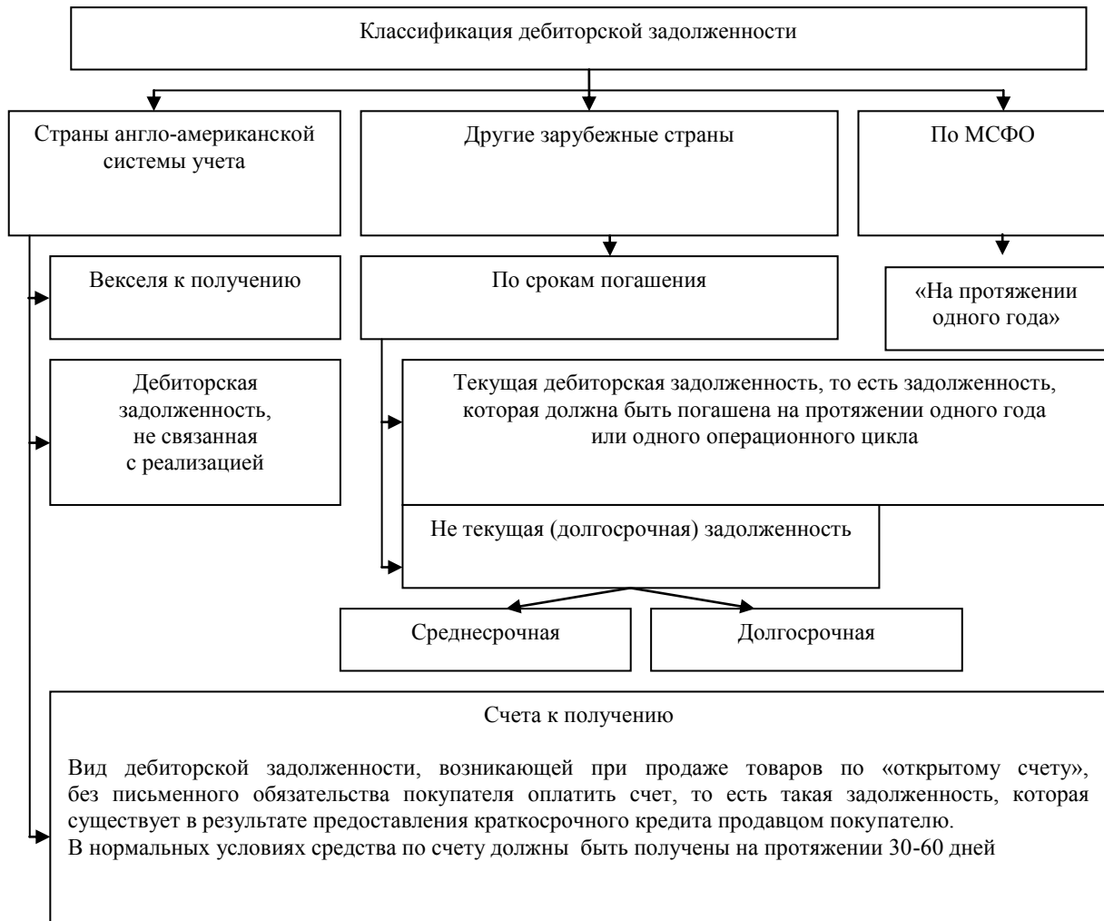
Рис. 1. Классификация дебиторской задолженности в зарубежных странах

Важную роль в бухгалтерской практике имеет отображение сомнительной дебиторской задолженности и создание резервов под безнадежные долги. В США компании при списании дебиторской задолженности по счетам могут передавать свою дебиторскую задолженность третьему лицу, ликвидировав ее, таким образом, и получив определенную сумму денег. Способы передачи дебиторской задолженности в странах США представлены на Рисунке 2.