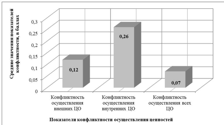
Рис. 1. Средние значения показателей конфликтности осуществления ценностных ориентаций (ЦО), в баллах

Обнаружен низкий уровень выраженности всех показателей конфликтности осуществления ценностей – средние значения показателей конфликтности не превышают данного в методике норматива в 0,89 балла. Однако сопоставление показателей выраженности конфликтности осуществления внешних и внутренних ценностей показывает, что подростки переживают конфликт осуществления внутренних ЦО несколько ярче, чем внешних (Рис. 1). Эти данные указывают на то, что подростки отводят первое место в значимости именно внутренним ценностным ориентациям. Следовательно, их недоступность будет порождать стойкий и глубокий внутренний конфликт.