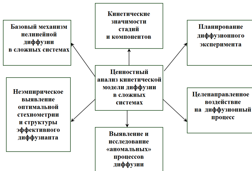
Рис. 2. Схема решения ключевых вопросов ценностного анализа сложного диффузионного процесса

Характер общности данного математического аппарата не позволяет точно установить роль отдельной стадии и отдельного компонента в процессе диффузии. Необходима оценка ценности каждой стадии и каждого компонента в сложном процессе диффузии. Аналогичные задачи для сложных химических реакционных систем были решены путем применения ценностного подхода, заимствованного из нейтронной физики [2; 5; 7]. Задача ценностного анализа сложного диффузионного процесса – это определение ценностного вклада каждой стадии и каждого компонента для выделения базового механизма диффузии, для целенаправленного воздействия на диффузионный перенос, для выявления и исследования аномальных явлений («восходящая диффузия», спиноподальный распад и др.), для планирования диффузионно-лимитированного эксперимента (см. Рис. 2).