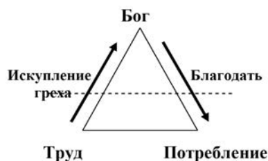
Рис. 1. Замкнутость труда и потребления на божественной инстанции

Наиболее отчетливо теонимический характер отношений производства и потребления представлен в монастырях, где послушный Богу монах не получает за бремя своего благодарного труда деньги, но и в монастырской трапезной не платит за еду (экономика христианских монастырей - эпифеномен безденежной экономики, обоснованной позже коммунизмом Маркса, но на совершенно иных принципах). Благодарно работая на Бога, монах с благодарной молитвой получает от Бога плоды своего труда, преобразованные в священные дары. Отнесенность баланса спроса и предложения к Богу - «Бог взял, Бог дал» - вписывает в порядок теонимического обмена заранее, предвечно заданный порядок. Вера в эту божественную справедливость распределения богатств - условие отсутствия в Средневековье экономических кризисов и социального недовольства, поскольку «церковь удерживала экономику в состоянии относительной стабильности» [Там же, с. 180, 183].