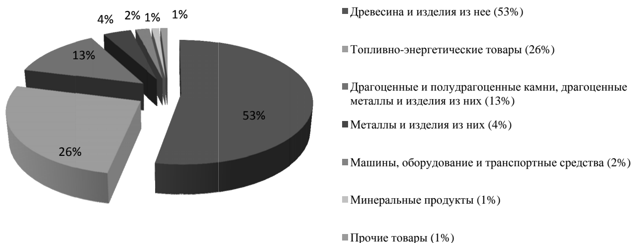
Рис. 1. Структура экспорта Амурской области в 2010 г. (%) [6]