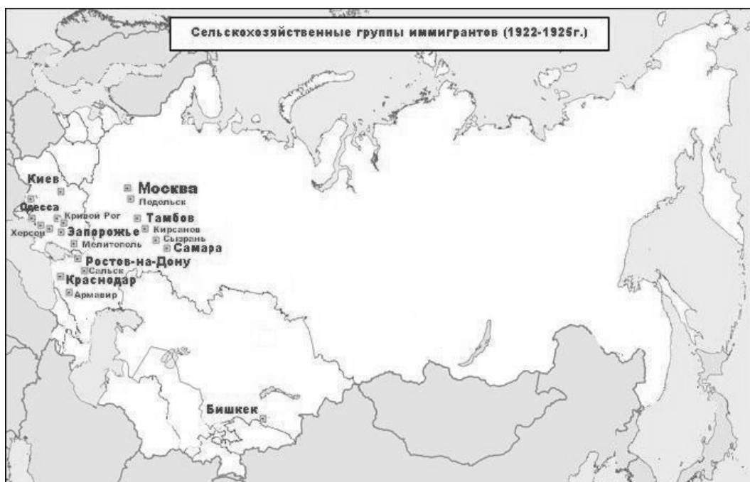
Рис. 3. Основные районы земельного фонда, отведенного с.-х. группам иммигрантов в период с 1922 по 1925 гг. [2, д. 1, л. 46].

В области сельскохозяйственной иммиграции постановлением СТО РСФСР от 2 февраля 1923 г. «О сельскохозяйственной иммиграции» было предусмотрено отведение Наркомземом РСФСР иммигрантам земельного фонда [4; 6; 7]. Законодательством устанавливался отвод земли для сельскохозяйственной иммиграции в размере 220 000 десятин, преимущественно на юго-востоке и в Поволжье (см. Рис. 3). По состоянию на 1 июля 1925 г. в использовании у иммигрантских сельскохозяйственных групп (коммуны, артели, товарищества) находилось 23 397 дес. земли [2, д. 1, л. 46].