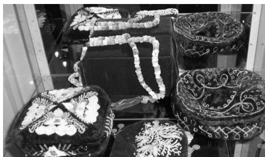
Рис. 2. Татарские «тюбетейки»

Специфической чертой татарского орнамента является преобладание цветочно-растительных сюжетов и отсутствие зооморфных мотивов, что объясняется догмами исламской культуры [3, д. 2, л. 6]. В цветовом отношении для всех видов изобразительной орнаментики татар характерна необыкновенная полихромность [12, с. 43]. На Рисунке 2 представлены «тюбетейки» – головные уборы татар из фонда «Музея этнографии» ФГОУ ВПО «Самарской государственной академии культуры и искусств». Здесь можно увидеть цветочно-растительный орнамент, характерный для традиционной культуры татарского народа. Цветочные мотивы в орнаменте символизируют лаконичность природы, беспредельность ее совершенства.