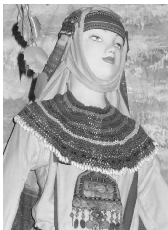
Рис. 4. Праздничный костюм молодой женщины. Чувашки

Особенность чувашского орнамента проявляется в его геометризованном характере [4, д. 3, л. 12] и отсутствии в нем антропоморфных мотивов (изображения человека). В отличие от орнамента соседних угрофинских народов для чувашского орнамента характерны замкнутые, четко очерченные композиции [10, с. 34]. Кроме того, вышивка, украшающая чувашский костюм, донесла до наших дней древнейшие знаки рутинического письма – письменность предков чувашей [14, с. 37]. На Рисунке 4 представлен чувашский праздничный костюм молодой женщины (конец XIX – начало XX века) из фонда ГУК СО «Самарского областного историко-краеведческого музея им. П. В. Алабина». Важной символической и одновременно декоративной, определяющей частью женского костюма являлся полотенчатый головной убор – «сурпан». В способах ношения «сурпанов» отражались древние представления о строении вселенной и неразделенности миров – небесного, земного, подземного. Характерными элементами для орнаментации чувашского «сурпана» являются расположение узоров на концах поперечными ярусами с четко выраженным симметричным повторением и окаймление по всему периметру красным цветом.