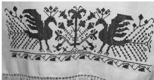
Рис. 1. Полотенце русское с кружевом

Тем не менее, для каждого народа характерна своя специфика. Особенностью русского орнамента является наличие всех его видов: геометрического (круги, кресты, ромбы, квадраты), антропоморфного (изображение женской и мужской фигуры), зооморфного (птицы, животные), растительного [8, с. 11]. Необходимо отметить, что геометрический орнамент наиболее характерен для южнорусского населения Самарской области, а растительный – севернорусского [13, с. 91]. Но в некоторых районах Самарской области наблюдается своеобразный симбиоз [2, д. 2, л. 30]. На Рисунке 1 представлена вышивка на русском полотенце с кружевом (первая четверть XX в.) из фонда МУК «Краеведческого музея» города Тольятти Самарской области. На полотенце изображена «птица» – один из любимых и наиболее распространенных образов в русской вышивке. Птица – знак весны, удачного брака, материнства, воскресения природы, пробуждения земли, рассвета, хорошего урожая.