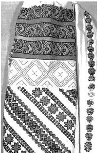
Рис. 3. Символы восьмиконечной звезды на орнаментах вышитой сорочки. Начало XX века

В ходе нашего исследования нами была выявлена кукла, которая по форме напоминает традиционную народную куклу и на лице которой изображен геометрический орнамент сложной формы в виде «восьмиугольной розетки» (звезда). Такая кукла зафиксирована нами впервые. В ходе сравнительного анализа нами был также выявлен факт, что в некоторых орнаментах украинских традиционных сорочек Западной Украины (Покутье) существовала такая же форма восьмиконечной звезды.