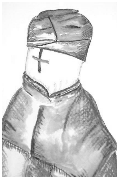
Рис. 2. Кукла из собрания Н. Бартрама, ныне в Музее игрушки (г. Сергиев Посад). Зарисовка О. А. Скляренко

Показательным является наличие двухцветного креста на лице куклы, которая была обнаружена Н. Бартрамом в начале прошлого века (Рис. 2).