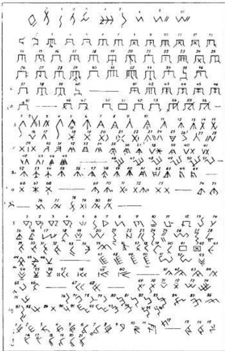
Рис. 2. «Пусы»-тамги удмуртских родовых групп [3]

Исходя из древних преданий, каждая удмуртская девушка носила на левой части груди медную или оловянную пластинку, особый жетон, на котором изображался символический знак. По этому знаку можно было определить, из какой деревни родом эта девушка, замужняя она или нет. Возможно, что, исходя именно из этих традиций, большинство данных имён имеют женский род [Там же, с. 276-279].