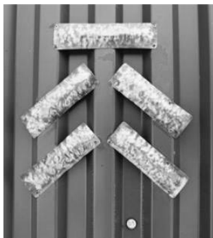
Рис. 1. «Пус» рода Ишмуратовых. Латунь, чеканка, 2012 г., авторский образец

Одним из наиболее значимых элементов культовой орнаментики удмуртов является «тамга», или «пус», – бортное пятно, которое использовалось удмуртами в качестве печати или подписи и получило наиболее широкое распространение в домовой резьбе и росписи [3, с. 280]. «Подэм пус» изображался обычно на древесине в качестве зарубок, сделанных топором, отсюда и название «рубленный знак». Тамгой родовой семьи Чабья было «стремя», Ворча – «куриная нога», встречались также «лестница», «грабли», «грудная клетка», «вилы», «скамья» и т.д. [Там же, с. 280-282].