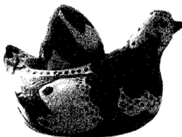
Илл. 6. Курочка-Ряба. Мастерская «Крекер» под рук. Е. С. Соловьевой (СДДЮТ)