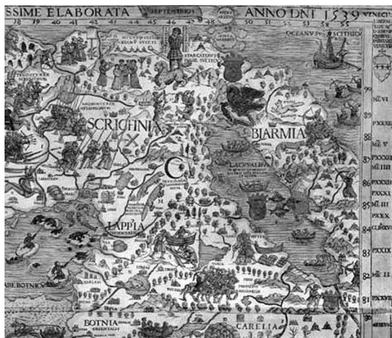
Олаф Магнус. Фрагмент карты «Carta Marina». Гравюра (1539, Венеция).

Так, одним из первых, выявленных на данный момент, изобразительных текстов светского характера, созданных на территории Кольского полуострова, является европейская иллюстрированная карта шведского историка, дипломата, писателя и географа первой половины XVI века, архиепископа упсальского Олафа Магнуса (Olaus Magnus) – «Carta marina et descriptio septentrionalium terrarum ac mirabilibus rerum eis contentarum, diligentissimo elaborata anno Domini 1539. Venetiis; reverendissimi d. Ieronimi Quirini patriarchae venetiano» (Венеция, 1539; пер. – Морская карта и описание северных земель с удивительными вещами в них содержащимися, старательнейше обработанная в год от рождества Христова 1539 в Венеции, изданием достопочтеннейшего отца Иеронимо Квирина, патриарха венецианского). Большая гравюра на дереве, отпечатанная на девяти листах, помимо детального изображения особенностей географического ландшафта полуострова, включала многочисленные иллюстрации этнографического и политического характера, повествующие о местах расселения автохтонного населения, их национальной одежде, особенностях жизни и быта, о торговых пунктах, способах передвижения и защиты [7]. Вся северная территория Восточной Европы до уральских гор названа на ней «Биармия».