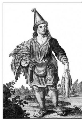
Лопарь. Ein Lappländer. Un Lappon.

Георги И. Г. «Лопарь». «Лопарская баба». Гравюра из книги «Beschreibung aller Nationen des Russischen Reichs... und übrigen Merkwürdigkeiten» (Санкт-Петербург, 1776-1780).