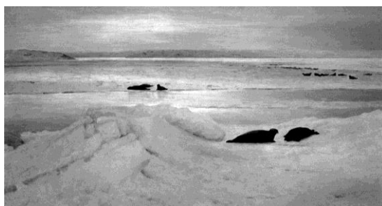
Борисов А.А. «Весенняя полярная ночь» (1897, ГТГ).

Произведения изобразительного искусства на Новой Земле и Лапландии в составе русской исследовательской экспедиции под руководством академика К. М. Бэра в 1837 году на двухмачтовом судне «Кротов» создавал экспедиционный художник Х. Д. Редер [8]. Ученому он был рекомендован не только как художник, но и как «молодой человек, имеющий геогностические (геологические) сведения и готовый к всяческим лишениям», что является важной особенностью любого экспедиционного художника [12]. Произведения Х. Д. Редера выполнены в технике литографии с авторской акварельной окраской и настолько точно воспроизводят картины природы арктического архипелага, что не лишены и сейчас естественно-научного значения. Нельзя отказать им и в чисто художественной ценности.