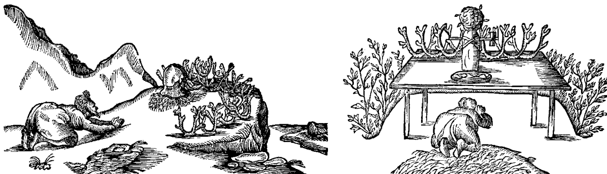
Иоганн Шеффер. Поклонение тотему (у сейда). Гравюры из книги « Lapponia » (1673).

Также в 1601 году во Франкфурте была отпечатана миниатюрная иллюстрированная карта « Lappia » фламандского картографа, автора сборника «Театр мира» из 53 карт Абрахама Ортелиуса (Abraham Ortelius). Помимо географических особенностей ландшафта Кольского полуострова, как и Ян ван Линсхотен, он изобразил якорные стоянки, крепость в Коле, населенные пункты по берегам, а на мысе Святой Нос обозначил поморский крест. Этнографические зарисовки сделаны также на первой печатной шведской карте « Orbis arctoi imprimisque amplissimi regni Sueciae tabula » (1626) картографа Андреаса Буре (Andreas Bureus) [5].