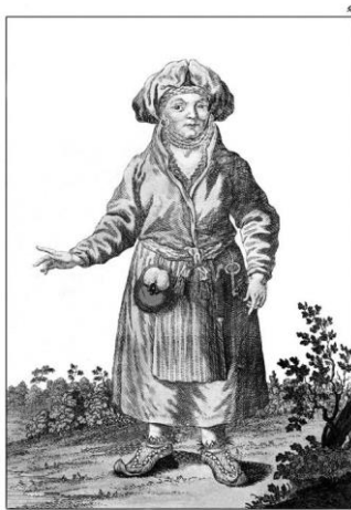
Лопарская баба. Eine Lappländische Frau. Une femme laponne.

Существуют также иллюстрации, которые были выполнены не с натуры, а по воображению, под впечатлением от рассказов путешественников или по более ранним гравюрам и картам. К одной из таких работ относится иллюстрация из английского Атласа, выполненная картографом Моисеем Питтом (Moses Pitt), – «The Manner of the Laplanders living in Summer... in Winter» (Oxford, около 1680; пер. – Обычаи жизни лапландцев летом и зимой). Иллюстрация содержит целый ряд неточностей, что указывает на незнание автором специфики региона и подтверждает несомненный интерес средневековых исследователей к территории полуострова [6].