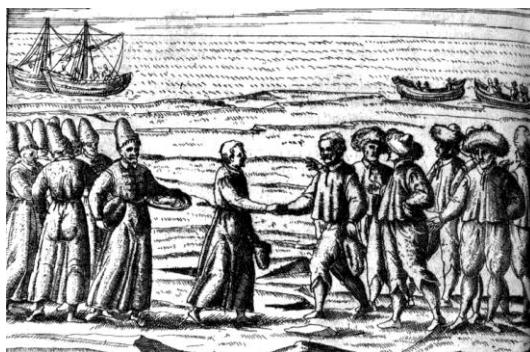
Геррит де Веер. «Встреча между русскими и голландцами после зимовки». Гравюра из « Diarium nauticum » (1598, Амстердам).