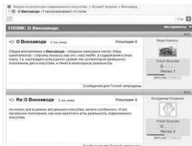
Рис. 2. Форум сайта ArtContext

В отличие от блога, тематические группы постов, предполагающие диалоговую форму общения, – форумы – подвижны, находятся в постоянном процессе смыслообразования и представляют собой разветвленную сеть цитаций, объединенных общей тематикой. Структура форума являет собой древо, истоком которого выступает так называемый корневой пост – сообщение, задающее направление в развитии диалога. Корневой пост, в отличие от блога-поста, – это открытое, чаще с вопросительной интонацией сообщение провокационной или иной побудительной формы, предполагающее отклик (Рисунок 2).