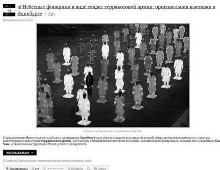
Рис. 1. Блог Культурология.рф

Проблема восприятия подобных полифункциональных художественных практик с использованием текста в качестве средства формирования и корректировки субъективного мира личности является проблемой опредмечивания мира чужой субъективности. Наиболее отчетливо данное явление раскрывает свои грани в процессе коммуникации, обмена информацией, в средствах массовой информации. На данный момент особое место в системе межкуммуникационного общения занимает блог (от web log – интернет-журнал событий, онлайн-дневник) – веб-сайт, основное содержимое которого составляют регулярно добавляемые записи (посты), содержащие текст, изображения или мультимедиа [5] (Рисунок 1).