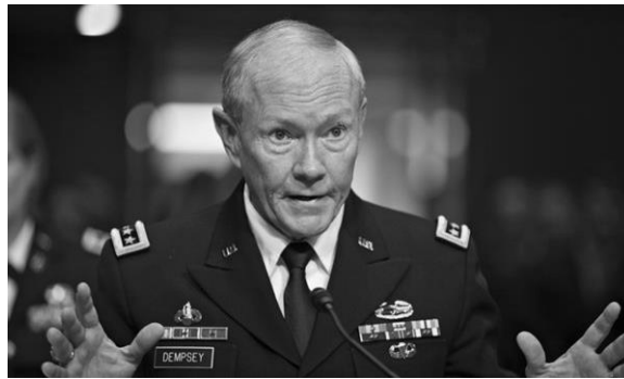
Рис. 2. Председатель Объединенного комитета начальников штабов генерал М. Демпси

о войсках также является вопросом построения доверия, который оказывается гораздо важнее материальных затрат: «если мы потеряем доверие, то не будет иметь значение, сколько денег мы тратим на вооруженные силы». Даже в условиях, когда на армию тратится в США огромное количество ресурсов, Демпси считает, что руководители обязаны прежде всего «ежедневно строить и заслуживать доверие своих подчиненных» [5].