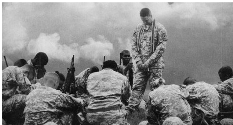
Рис. 1. Доверие религиозным институтам играет важную роль в системе ценностей военнослужащего США

Наставление по военному управлению в Вооруженных Силах США определяет доверие и компетентность основой лидерства и наиболее необходимыми качествами руководителя: «идеальный армейский руководитель имеет высокий уровень интеллекта, отличную физическую подготовку, является компетентным профессионалом с высокими моральными качествами и служит образцом для подражания», «командир всегда готов к решительным действиям в интересах военной организации», «военный руководитель строит отношения в армейском коллективе на взаимном доверии как во время мирных миссий, так и в ходе боевых действий» и т.д. Офицер Вооруженных Сил США призван «обеспечивать надлежащее обучение и уход за солдатами армии и гражданскими лицами» в целях поддержания высокого уровня доверия и выполнения поставленных задач [4].