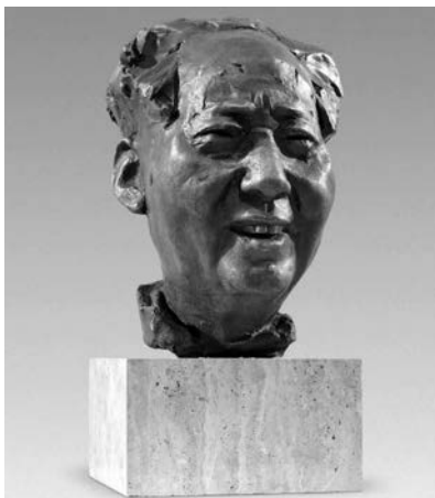
Рис. 1. Ли Сянцюнь. Мао Цзэдун под лучами солнца (2008)

Другая известная скульптура Ли Сянцюня – «Дэн Сяопин» – достигает 2,5 м в высоту, ее постамент выполнен из черного металла и мрамора, его длина 6 м, ширина 4,5 м, толщина 0,8 м. В этом произведении Дэн Сяопин изображен сидящим в плетеном кресле с сигаретой в руке, его облик являет нам пожилого добродушного человека из простого народа, его взгляд устремлен вперед. Основные детали, придающие живость его образу, сосредоточены в области рук, как будто окутанных дымом сигареты, в его лице во всей полноте отражена мудрость, в позе и изломах одежды – нелегкий жизненный путь.