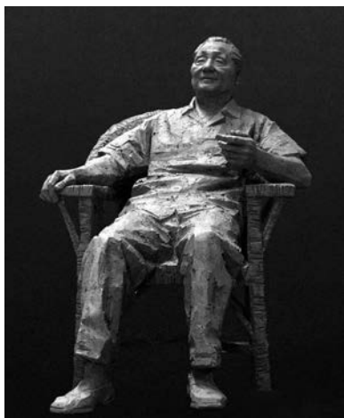
Рис. 2. Ли Сянцюнь. Дэн Сяопин (2004)